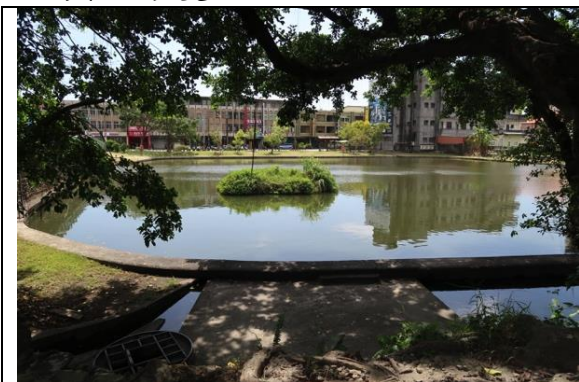
盧纘祥故宅前池塘現況