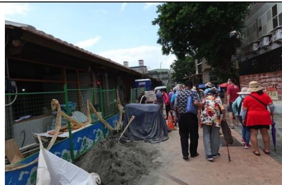
正在整修中十三行街屋