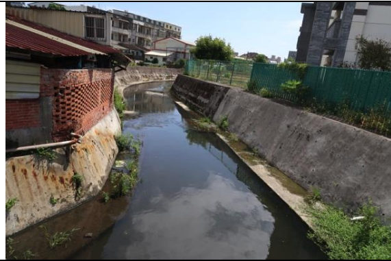
頭圍橋上往水路眺望