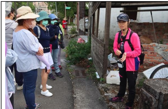
武營路上石敢當與養豬空間