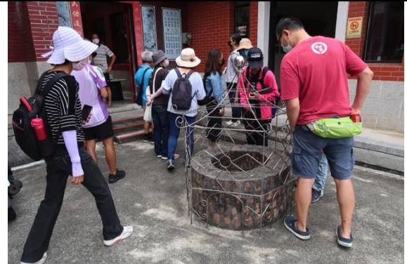
取水磨墨用之井水