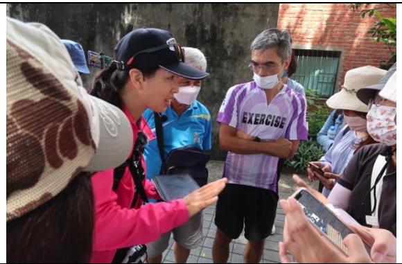
南門土地公廟前解說