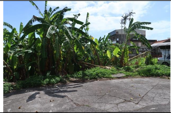
和平街北段舊渡口現況