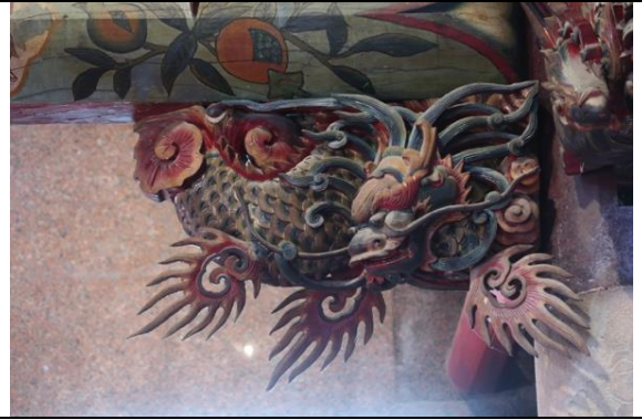
慶元宮屋架木作雕飾