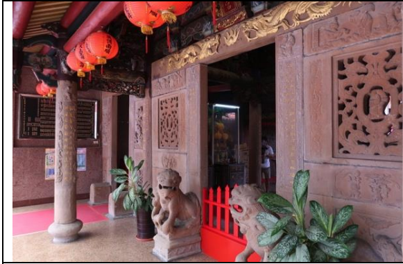
慶元宮的砂岩石雕