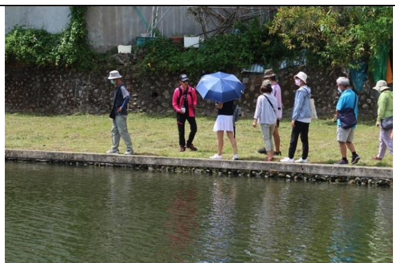
盧纘祥故宅前池塘