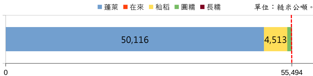
圖 1 109 年本縣稻作種植產量結構

本縣 109 年稻作產量為 55,494 糙米公噸，其中蓬萊 50,116 糙米公噸最高(占 90.31%)，秈稻 4,513 糙米公噸次高(占 8.13%)，合計占本縣各類稻作之 98.44%，為主要生產類別。(如圖 1)