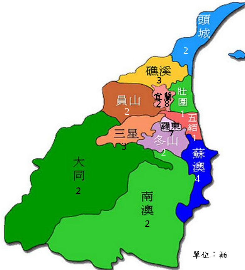
圖3、宜蘭縣救護車設置概況-依鄉鎮市別分

105 年本縣救護車依鄉鎮市別分，最多數為宜蘭市計 28 輛(占 49.12%)，次多數為羅東鎮計 7 輛(占 12.28%)，再次者為蘇澳鎮計 4 輛(占 7.02%)。(詳如圖 3)