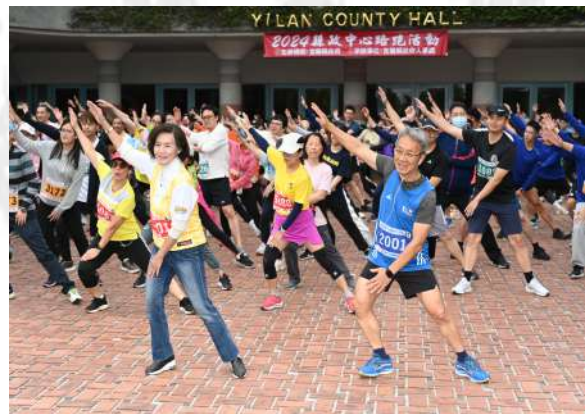
縣長及副縣長一同與選手們跳熱身操