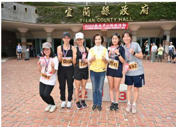
恭喜女子甲組前五名得獎選手