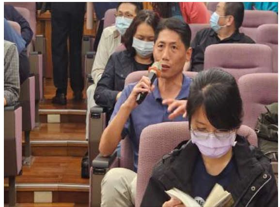
學員發表活動中的感受與想法