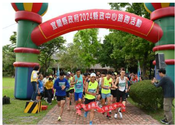
縣長鳴槍-宜蘭縣政府2024縣政中心路跑活動正式起跑