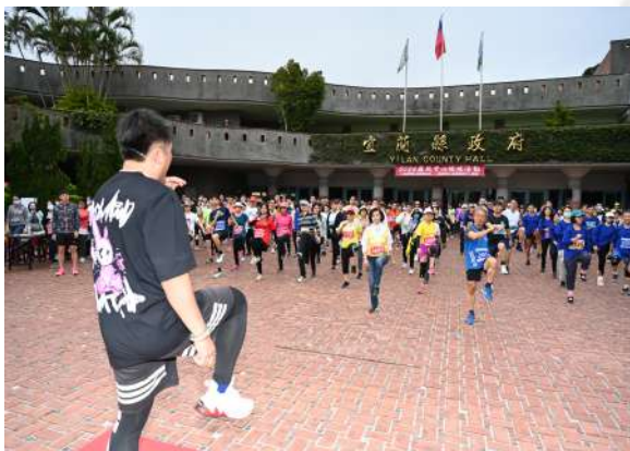
邀請體適能教練來為選手們帶操熱身