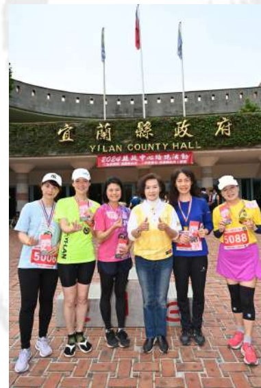
恭喜女子乙組前五名得獎選手