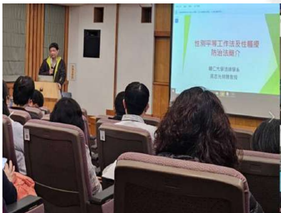
講座介紹性別平等工作法及性騷擾防治法 修正重點

為增進本府各單位、一級機關科長層級主管人員，了解性平三法修正後，該如何防患處理性騷擾事件及善盡角色責任，本府於113年3月4日（星期一）分上、下午2梯次辦理「中階主管研習班—性騷擾防治專題」，除由勞工處及社會處加強性騷擾相關業務宣導外，邀請輔仁大學法律學院院長吳志光教授主講「因應性平三法修正公部門應有的認知及作為」，合計118人次參訓，課程中講師運用影片及實務案例，讓參訓學員多所獲益。