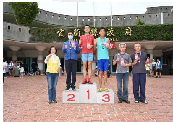
恭喜男子乙組前五名得獎選手