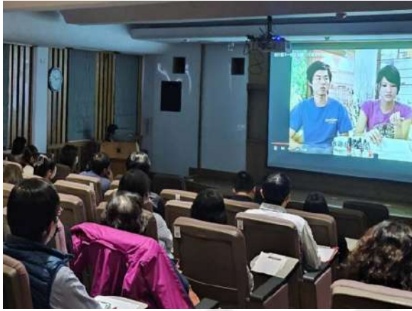
透過影片實例講解