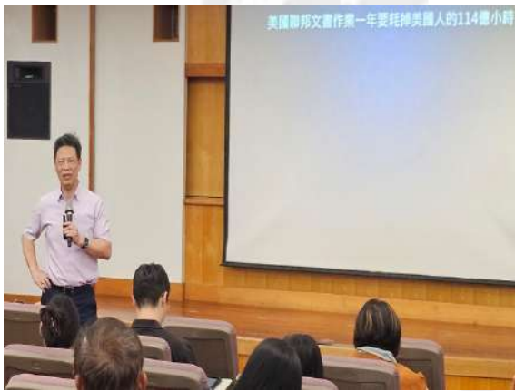
淤泥效應例子：美國聯邦文書作業 一年要耗掉美國人的114億小時