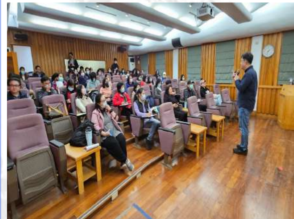
證券分析師成中興講師講授投資理財觀念及可能遇到的風險