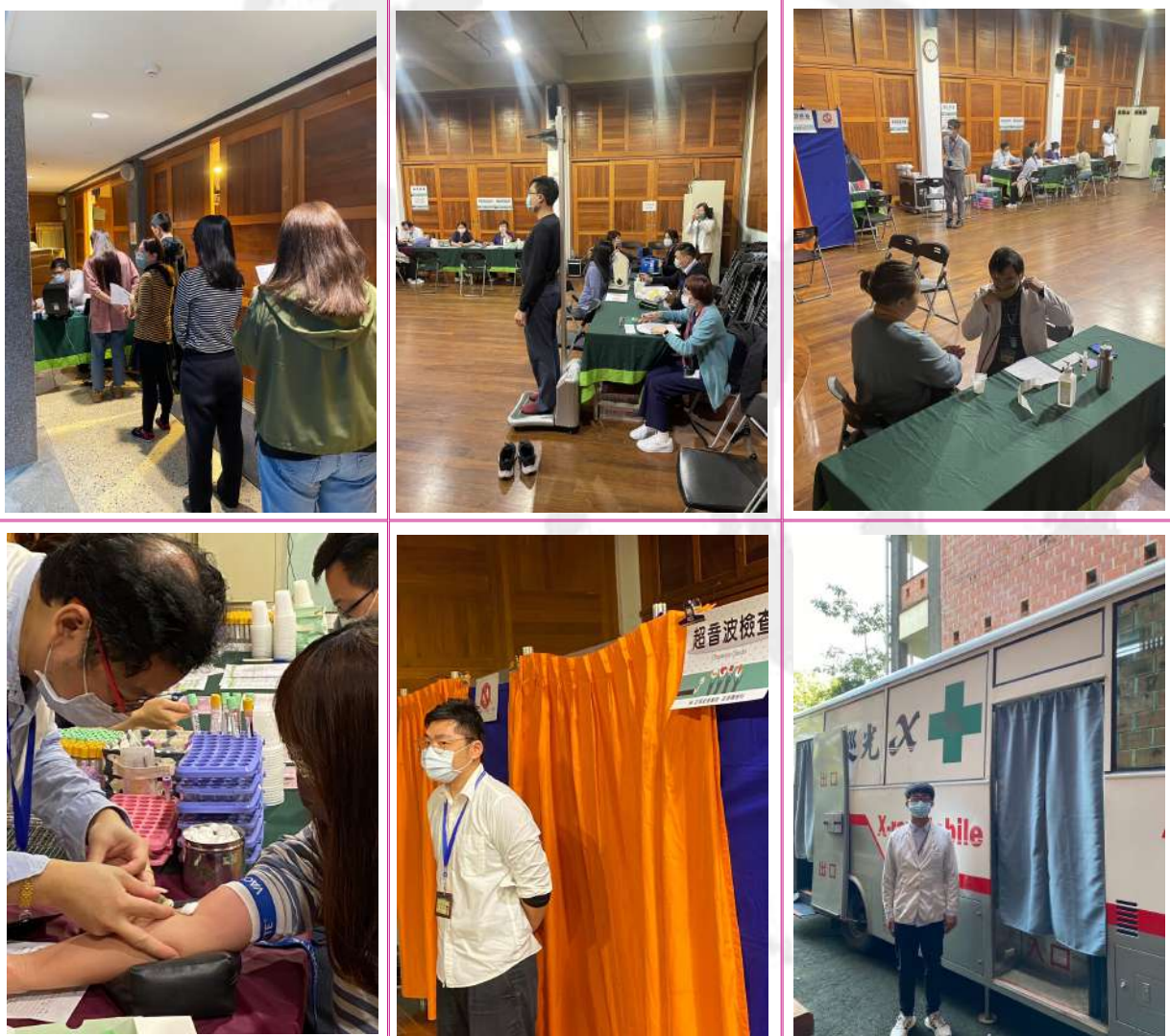
縣府邀請亞東醫院合作辦理員工健康檢查活動，以維護同仁身心健康

為維護同仁身心健康，本府與亞東醫院合作辦理員工健康檢查活動，於113年3月5日至3月7日至本府及社會處提供服務，同仁報名踴躍，三場受檢人數共計160人。