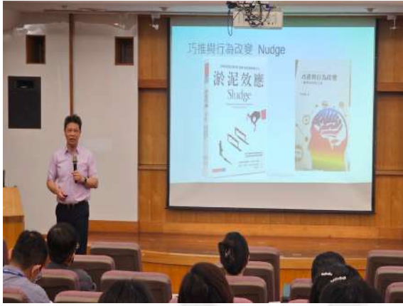
講師導讀淤泥效應並提供巧推技巧去除汙泥