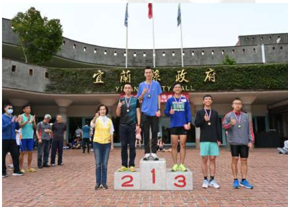
恭喜男子甲組前五名得獎選手