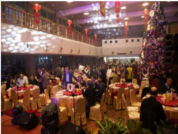
縣府員工歲末聯歡晚會在縣民大廳舉辦，現場席開127桌

餐點運用宜蘭在地食材烹飪，讓同仁品嚐蘭陽特色美食合菜；晚會邀請多組表演團體接力演出炒熱氣氛，還有同仁們最期待的重頭戲-摸彩環節，希望可以抱回大獎。今年摸彩品項大部分為宜蘭縣社會福利聯合勸募基金會之愛心禮券，讓同仁在中獎歡樂之餘，能兼顧關懷弱勢團體。