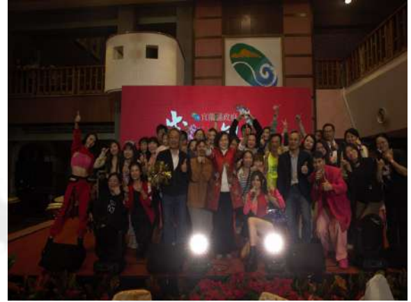
三長與縣府同仁親切互動、歡樂，一同在舞台上唱歌、跳舞