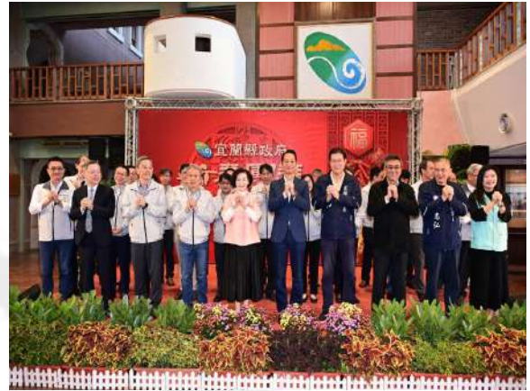
縣長率行政團隊及議員們向同仁道恭喜