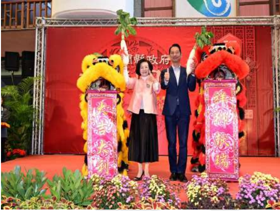
邀請縣屬七賢國小醒獅隊開場表演「祥獅獻瑞·好運龍來」