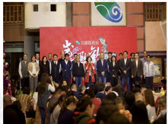
縣長、副縣長及秘書長（下稱三長）率領局處首長慰勉同仁，期許和同仁們作伙打拚