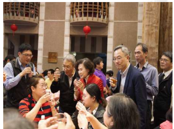
三長逐桌向同仁致意問候