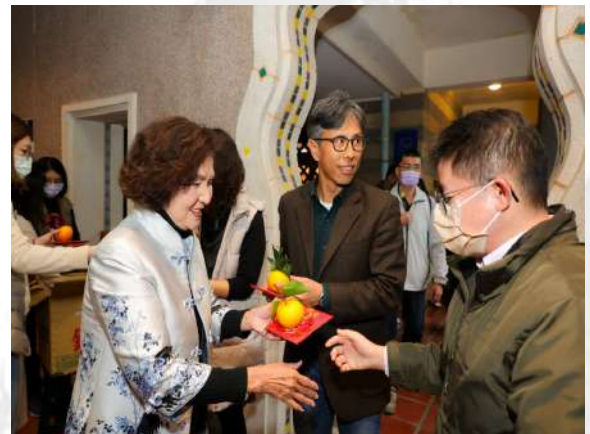
縣長發送好運龍來紀念紅包及橘子給縣府同仁