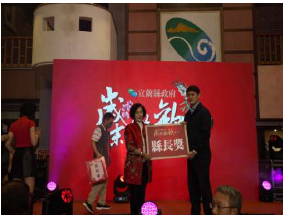
恭喜幸運同仁抱回縣長獎