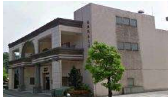
宜蘭縣政府消防局 108 年 01 月更新

永光社區活動中心 面積：750 平方公尺 容納：114 人 地址：永光里蘇港路 85 號 電話：03-9965513 適用災害類別：水災、震災、海嘯、土石流