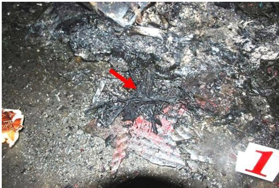
圖 4. 香燭燃燒遺留物