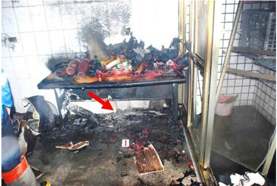
圖 3. 置物桌下方燃燒劇烈處