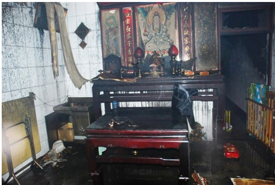
圖 2. 神龕未受火勢燒損情形