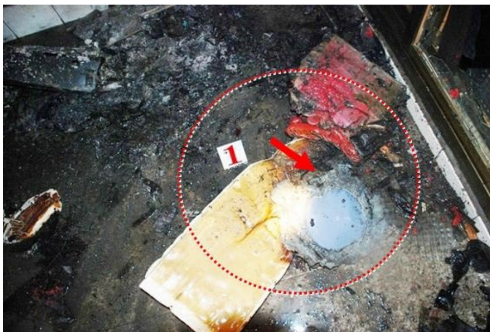
圖 5. 垃圾桶燒損殘留物