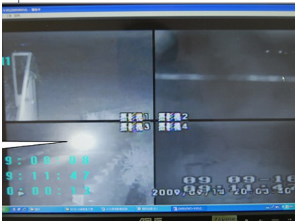
圖 3. 調閱附近攝影機 3 螢幕發現嫌疑人騎乘機車出現起火戶附近