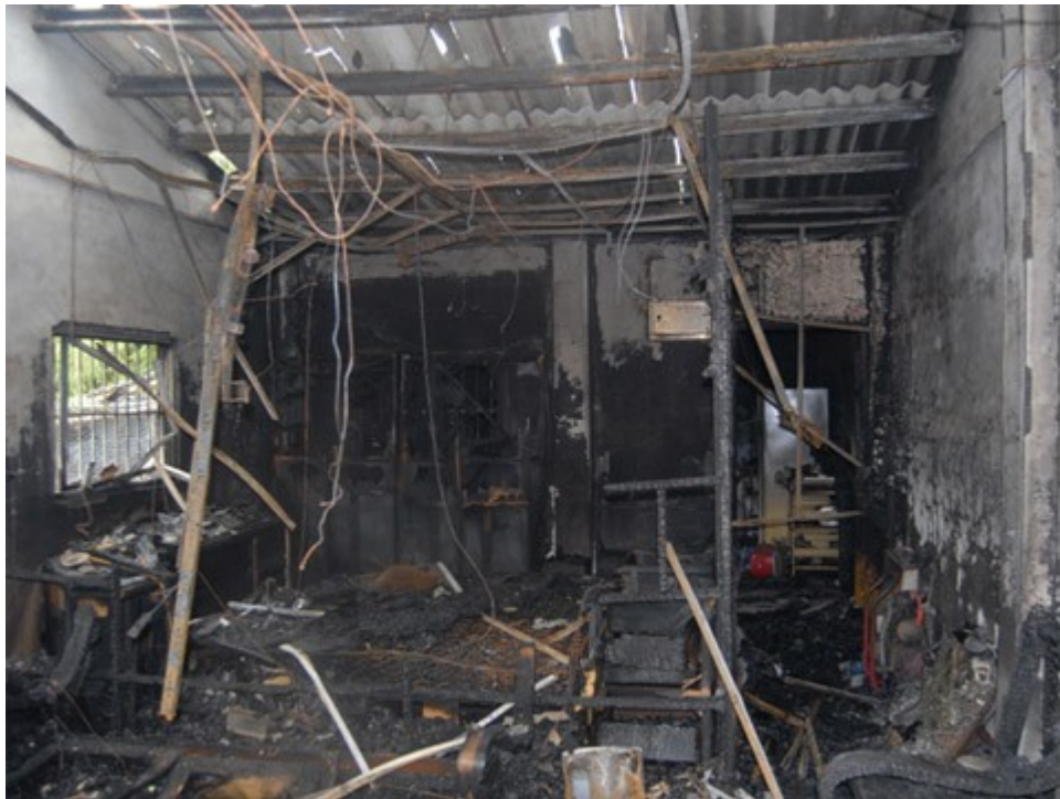
圖 2. 現場燃燒狀況