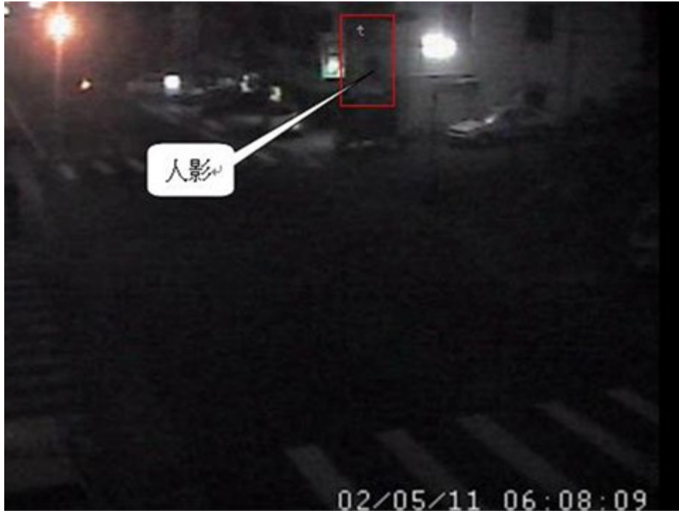
【圖4 可疑男子由2樓跳下逃離】