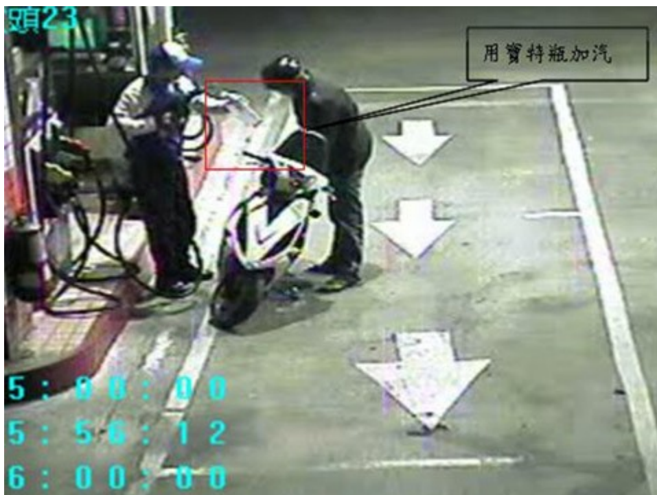
【圖3 可疑男子以寶特瓶加油】

(八) 社區應增加巡守隊功能，若發現可疑人物逗留現場，警衛或住戶應立即前往查看，並有效嚇阻犯罪發生。