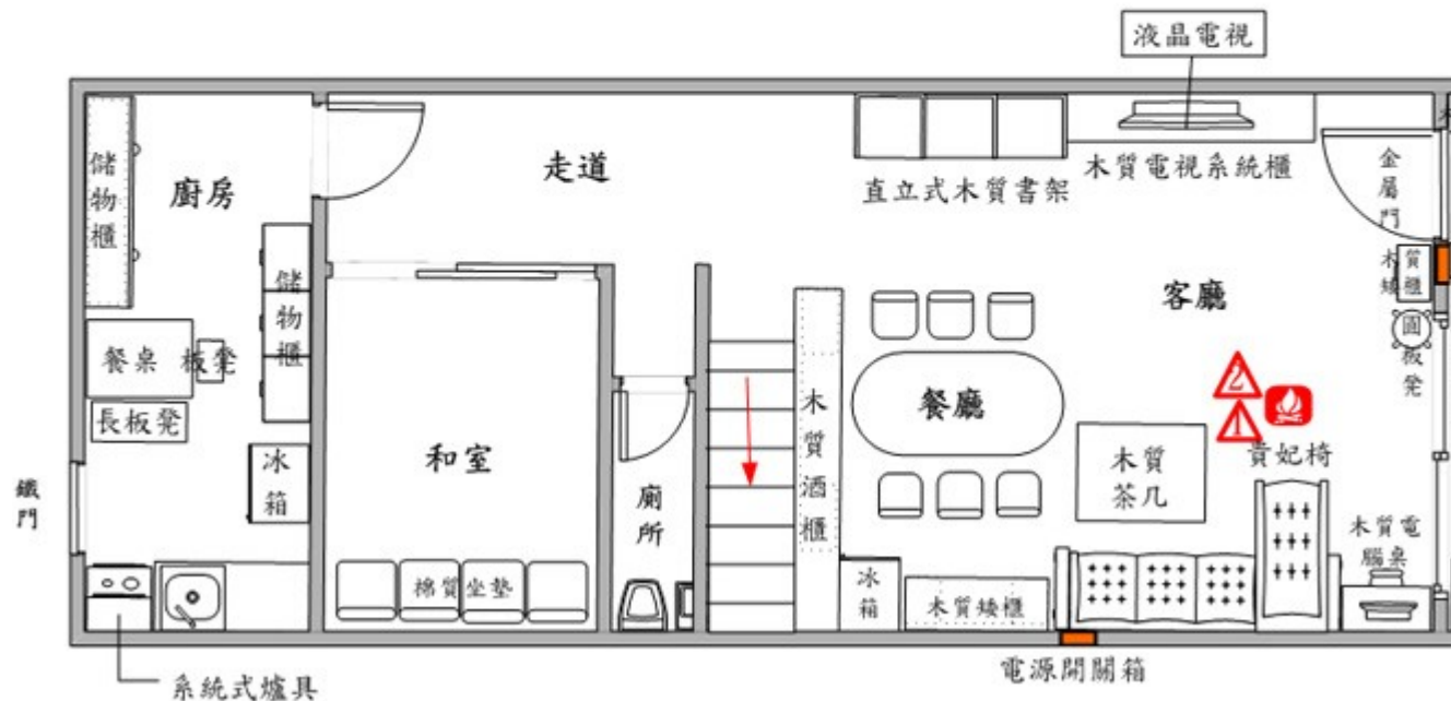
圖1：火災案現場1樓物品配置圖