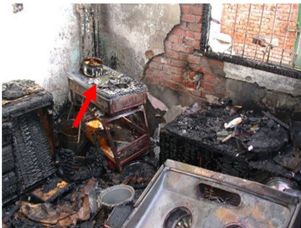
圖 2：現場廚房內靠西北側瓦斯爐上方發現一受燒鍋子。