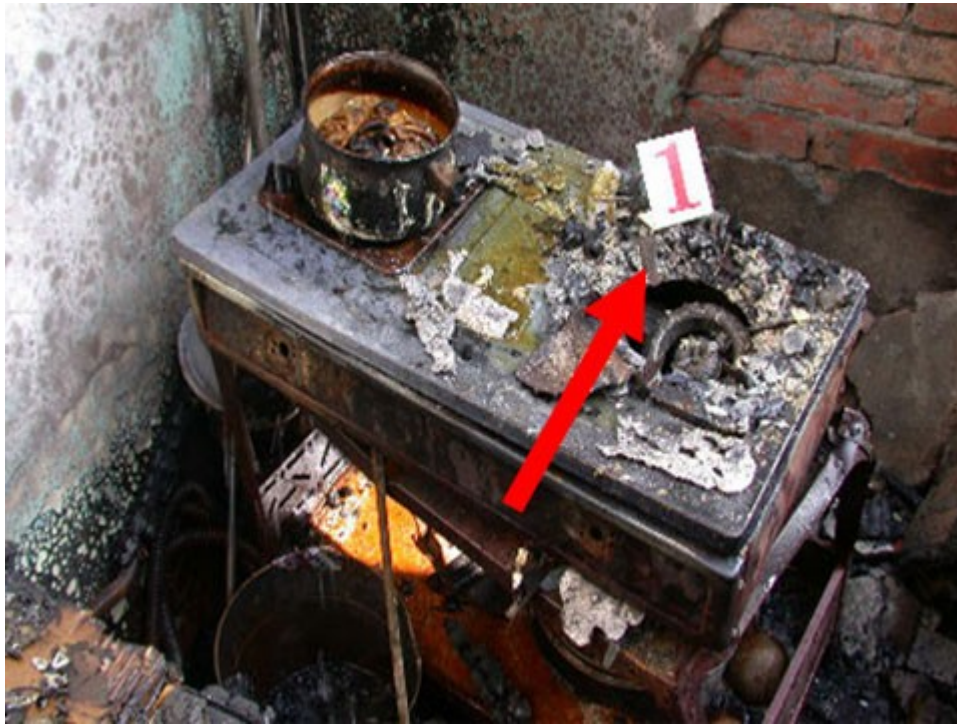
圖 3：經勘查清理後發現該瓦斯爐靠東側（編號 1）原物鍋子已燒熔消失。