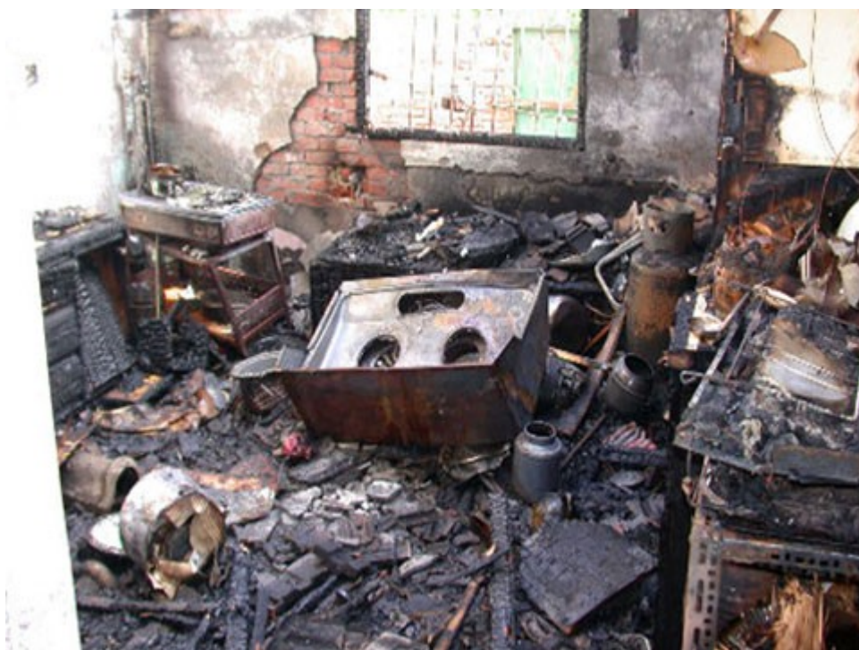
圖 1：現場 1 樓靠北側廚房內部受燒嚴重。