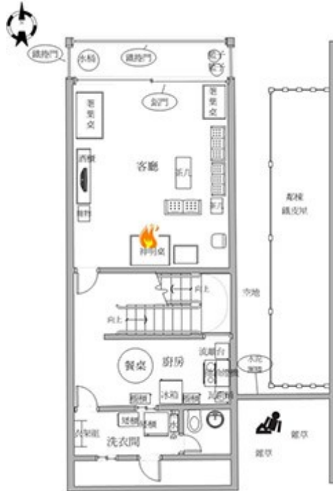
圖1：火災戶1樓平面配置圖、人員死傷位置及起火位置圖