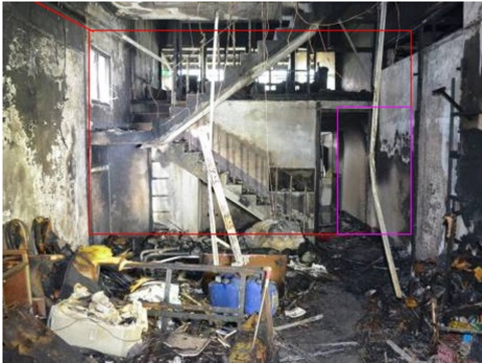
圖3：據屋主表示，起火戶1樓「客廳」南側原為擺放神龕之處所，樓梯與客廳間以木質合板隔間，並有裝設木質門片，樓梯下方之空間亦以木質合板建構一儲藏室之空間，屋主所稱之木質隔間均已燒毀。