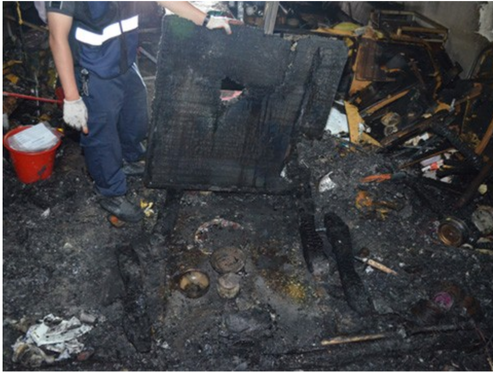
圖 5：該神龕靠隔間牆處燒失之孔洞，對照祭祀虎爺物品之位置，發現正好為虎爺前香爐之上方