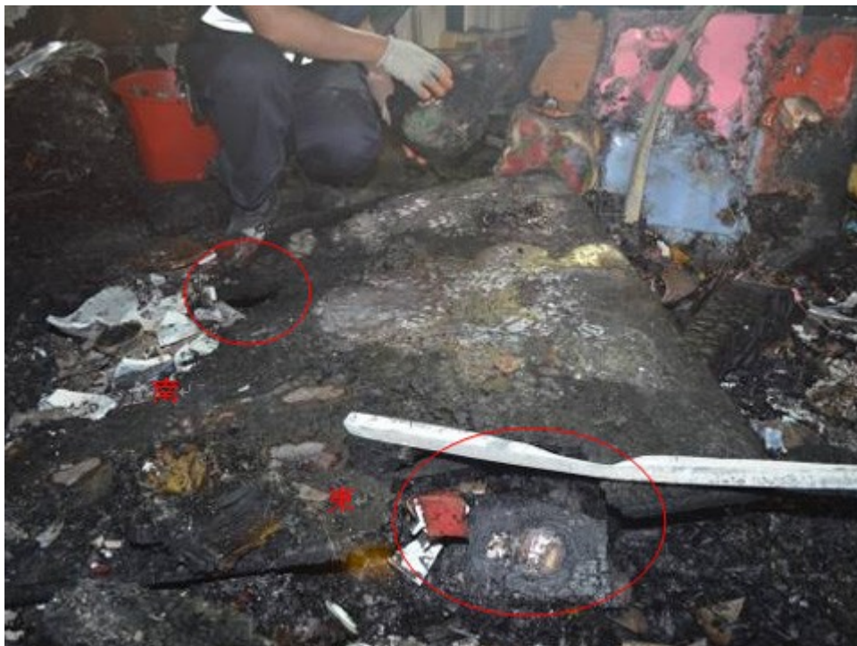
圖4：概觀神龕桌面共有東側及南側2處燒失（圈圈處），東側燒失之桌面下方可見一部分燒失之金紙堆。