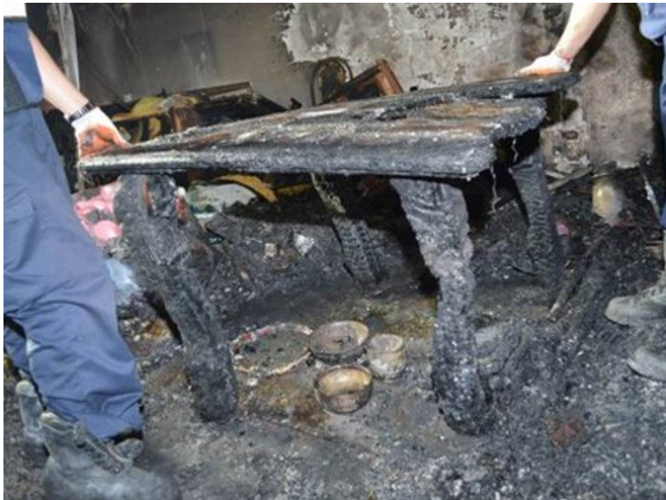
圖 6：復原神龕木桌，神龕下方有祭祀虎爺神明之物品，發現靠樓梯旁之一對桌腳受燒碳化及燒細情形較靠客廳處嚴重。