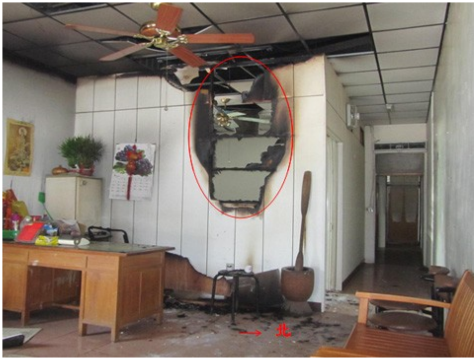
圖1：觀察青草店東側客廳，西邊隔間牆的夾板自離地約1公尺處往上至天花板局部炭化燒失，天花板部分燻黑掉落。