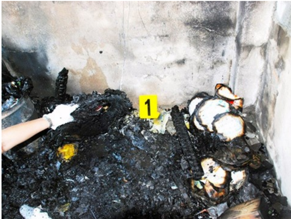
圖4. 勘查挖掘起火處附近僅發現木材及紙張燒燬碳化物，附近未發現有電氣設備通電使用情形。