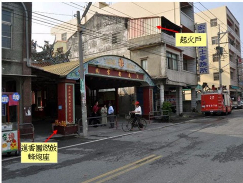
圖 6. 據起火戶所有人筆錄表示火災發生前有進香團至咸安宮進香並燃放冲天炮