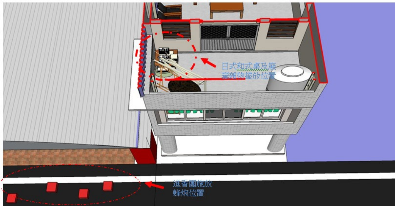
圖 2. 起火處相關位置說明