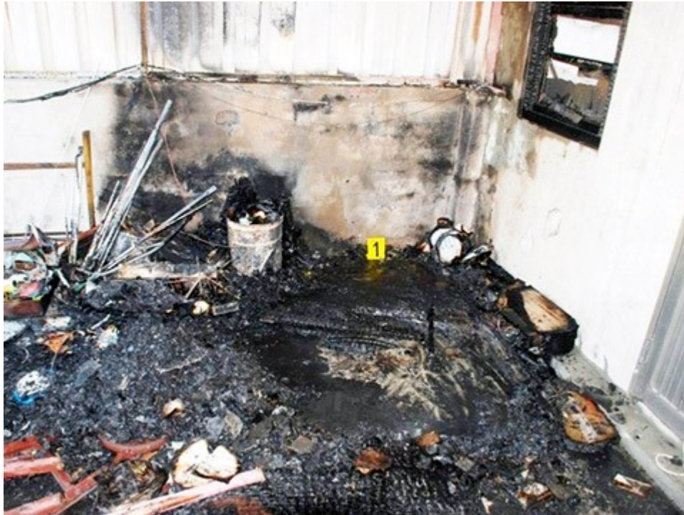
圖 5. 清除起火處除殘留木材及紙張燒損嚴重碳化物外，未發現其他可疑發火(源)物。