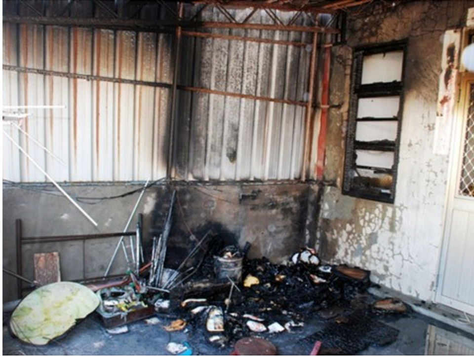
圖3. 住宅3樓鐵皮加蓋置物間；位於西南側處擺放木製和式矮桌及紙堆呈現受火煙燒損情形，西側室內神明廳僅窗戶受火勢波及燒損。