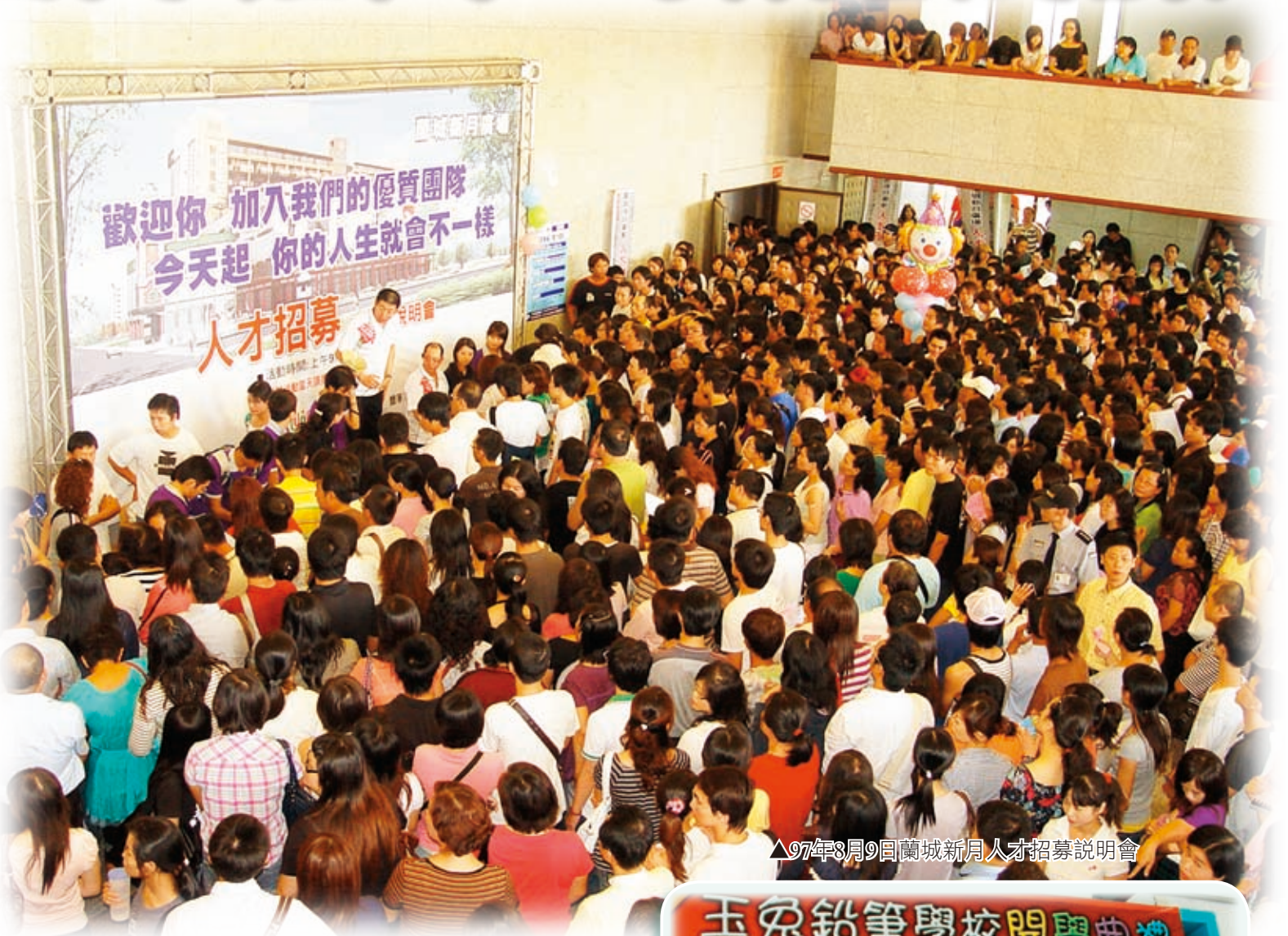
▲97年8月9日蘭城新月人才招募說明會

在縣府大力招商下，短短二年內，利澤工業區不再是放牛吃草，工業區內已開發的第一、二、三期土地，租售比率接近100%。如同經濟日報97年8月13日報載：「利澤工業區，目前是全國人氣最旺的工業區，土地嚴重供不應求，將成為國內最大的太陽能新聚落。」