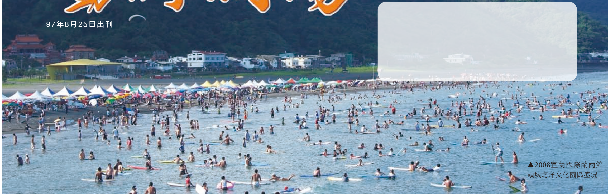
▲2008宜蘭國際蘭雨節頭城海洋文化園區盛況

出版單位：宜蘭縣政府 發行人：呂國華 地址：260宜蘭縣宜蘭市縣政北路1號 電話：(03) 925-1000 網址：http://www.e-land.gov.tw