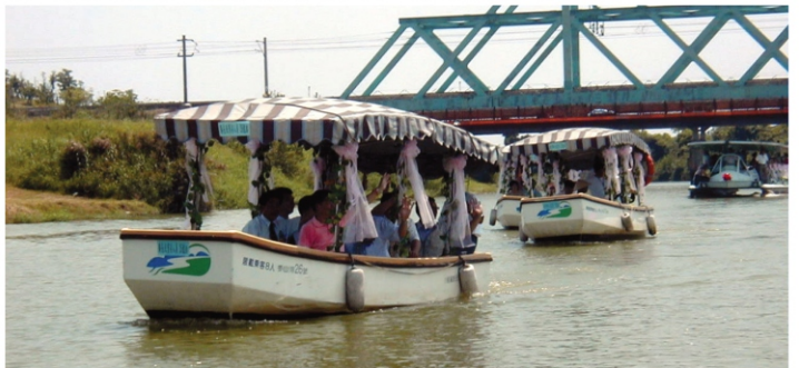
▲冬山河新航線啟航，帶動老街商機。

冬山舊河道及森林公園等新航道，營運初期採預約制，洽詢電話：03-9600013。