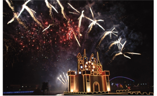
▲冬山河夢幻星河區燦爛的煙火秀，綻放出蘭陽的美麗夜色。