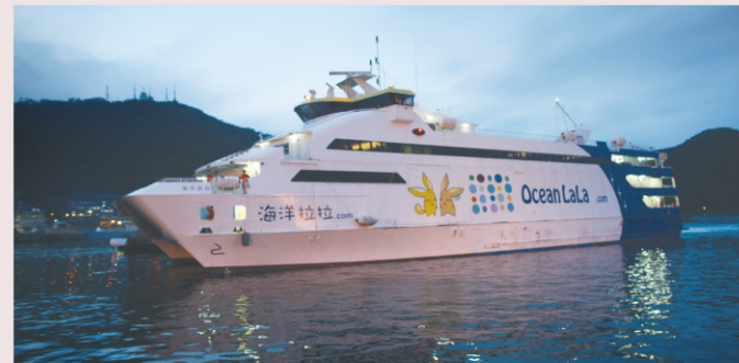
▲大陸浙江省台州市觀光團7月7日搭乘海洋拉拉號抵宜蘭，是蘇澳港首度有可輪從大陸直航。

台中港籍兩千噸客輪海洋拉拉號，七月七日載來318位浙江的貴賓和遊客，不但帶來龐大的觀光商機，更創下兩岸第一艘直航客輪，及蘇澳港首航客輪的兩個第一，真是三喜臨門。