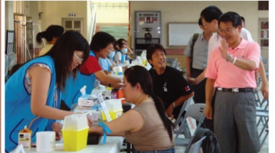
▲3039巡迴各鄉鎮市免費健康檢查

複查的項目包含：腰圍、血壓、血糖、高密度脂蛋白膽固醇、三酸甘油酯、肝功能、尿酸、肌酸酐等檢查。