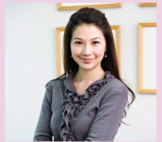
林書煒(電視新聞主播)

對我而言，愛上宜蘭的理由很簡單，因為我是道道地地的宜蘭姑娘！爺爺奶奶、外公外婆終其一生都生在宜蘭、住在宜蘭，而我6歲前的時光都是在太平山上的【獨立山】度過，甚至爸爸媽媽帶我來台北上小學前，「標準國語」都還講不出幾個兒字，卻是滿口ㄌㄨㄞ ㄌㄨㄞ(軟軟)、ㄇㄞ ㄇㄞ(酸酸)這種宜蘭口音的台語。宜蘭是個純樸、充滿人情味的好地方，好山好水帶給宜蘭人更溫潤的包容力與韌性，我們宜蘭人很少尖酸刻薄、鹹牙喇嘴的；我們通常很敦厚殷勤、努力打拚，即使顯得不夠聰明、機智，但我們一點兒也不在意，這就是宜蘭人可愛的地方！