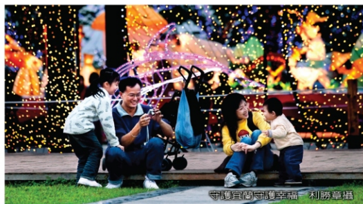
▲守護宜蘭守護幸福 利勝幸福

在打造幸福宜蘭方面，縣府推出全國首創的貧童免費安親及「3039健康久久」免費健檢，「脫貧方案」提撥比例全國最高，補助老人裝假牙、守護單親和外配幸福的「築親庭福利服務中心」，創新社會福利、加強扶貧助弱措施，嘉惠大家，深受肯定。