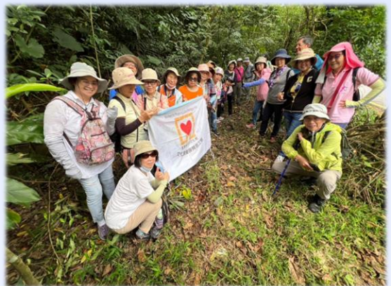
(32路牌處)夥伴砍樹除草後的舊軌步道合影