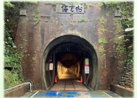
隧道北口「制天險」石額

舊草嶺隧道，是宜蘭線鐵道開拓史上最關鍵的隧道，長2166公尺，兩端赤煉瓦洞具有特殊的建築美感，隧道北口有總督府鐵道部長新鹿元之助所題的「制天險」石額，南口上方「白雲飛處」