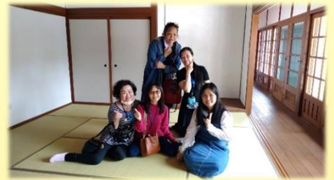
化龍一村未來是我們說故事的空間

四、 武營街 又名打鐵街，原是清兵訓練和刀鋸製修的場地，因社會型態改變而逐漸沒落，目前只是製修簡單鐵器及日常鑰匙的修配。