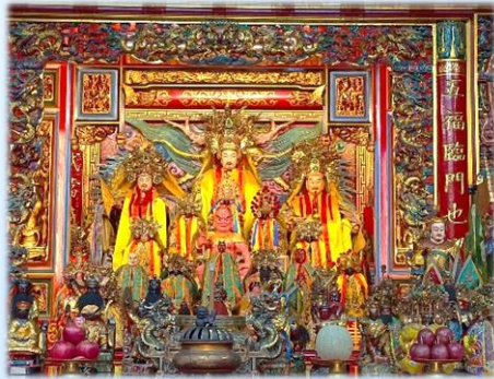
玄天上帝與神農大帝

羅東奠安宮俗稱「帝爺廟」或「上帝爺廟」，主祀玄天上帝，附祀神農氏。其實本廟原本主祀神農大帝，廟稱為「五穀王廟」現主祀是玄天上帝是有其故事的。「東勢」(羅東)先民以務農為主，崇敬「神農先帝」，於1851年(咸豐元年)集資建一間土埆厝奉祀，為「五穀王廟」。清嘉慶末年，一位大陸人士攜帶一尊「帝爺公」神像來臺，寄居於今鹿埔村龍目井，該地莊民欲建廟奉祀，因番害之故，「帝爺公」客居於「五穀王廟」。此時，羅東莊內發生瘟疫，「帝爺公」顯靈解決瘟疫問題，居民為了感謝神恩於1822年(清道光2年)7月，重建木造磚牆之宮廟，之後經神農先帝同意扶正玄天上帝為鎮殿主神，廟名命曰「奠安宮」。鹿埔人請杯(筊)求證，而與鹿埔人約定初一在鹿埔過火，初三在奠安宮過火，羅東巡境亦由鹿埔人抬神轎。