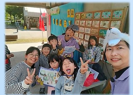
小朋友開心闖關成功

圖書館真是個好地方，各項疑難雜症，只要來圖書館借閱，任何問題幾乎都可以得到解答，當然也可以辦理線上電子書借閱，讓學習無遠弗屆，距離不再是問題。還有，2024「書香飄蘭城」行動巡迴書車的到場服務，只要有書車在的地方，就可以欣賞實體書籍，也可以現場辦理借閱，這貼心的服務，不知溫暖了多少偏鄉的大小朋友。最後要說到協助書車活動的醜小鴨故事劇團，每場次皆是絞盡腦汁，設計不同融入說故事與推動閱讀的方法，只為了讓大小朋友都能愛上閱讀、享受學習的樂趣。