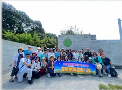
毓繡美術館大門留影

或許你不太喜歡說話或導覽，但喜歡分享或欣賞的人。身為志工，我們都各有所長，更重要的是學習與服務的熱誠，能在值勤時盡貴賓似的待客之道，讓訪客感受現場營造的氛圍。