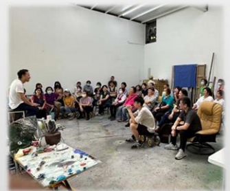
林萬士老師工作室參訪