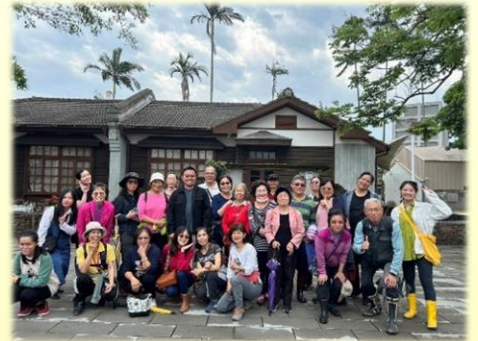
大夥在化龍一村合影

三、 化龍一村 原是礁溪電池廠兵工眷舍，在老兵逐漸凋零及幾十年的歲月摧殘洗禮後，建物空間早已不堪使用，現經過重修整建已將廢墟改成歷史文化的活用空間。