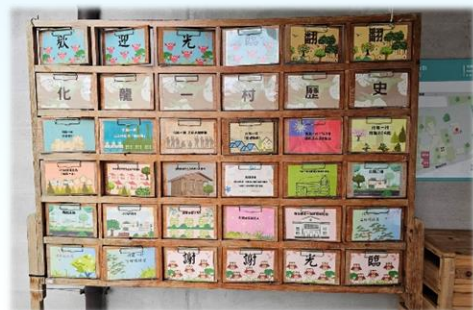
翻閱化龍一村的歷史

林老師在解說時，有人提問「為什麼叫化龍一村？」林老師說他也不知道，這時有成員站出來表示，聽長輩說 204 廠在抗日戰爭時，曾遷至四川的重慶，廠區旁有一座橋叫化龍橋，所以眷村在取名字時，找不到好名字，最後大家覺得這名字合適，就定案為「化龍一村」，林老師讚說，他也長知識了！還有志工說她兒時曾在村門口的芒果樹下玩耍，此地讓她充滿回憶。看來志工團內，真是臥虎藏龍，大夥兒得以互相學習，增進見識。