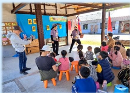
繪本故事說演《狐狸愛上圖書館》

1月30日，這屬於寒假的上午，來參加活動的孩子們都很雀躍，一開始宜蘭縣政府文化局的