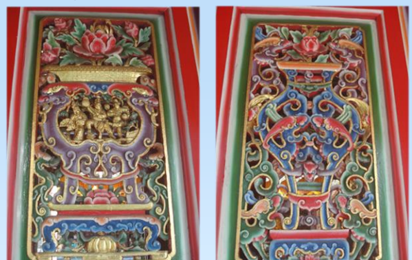
三川殿排樓格扇之「軟圓螭虎香爐」及「軟圓螭虎花瓶」雕刻