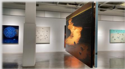
視網膜與石頭展在宜蘭美術館

看大小的石頭似飛天襲來、又像老僧靜止空中或水中，迴旋中的是無止境的自轉迷途？還是循著軌道？依著方向？波紋自空中撒下或往兩旁側身緩去，漸次沒入，也許在另個空間轉出立體，讓視網膜帶領攀高或落入深淵。穩定的筆觸，讓人屏神，觀者向時空問答，思考著的是線索嗎？將往何方？老師沒說，我們且等待…，一旦開啟創作思維，平易近人的林老師也是能言善道的，參訪兩個多小時，排排坐著聽的志工們，如沐春風，感受藝術家真性情，啊！意猶未盡。