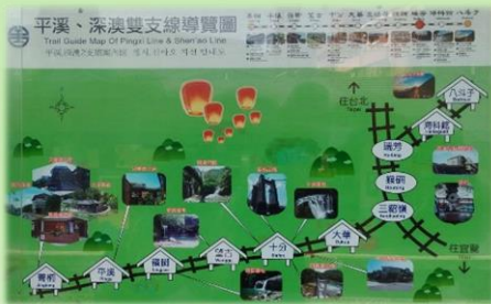
平溪、深澳雙支線示意圖

平溪支線上的平溪小鎮，在清代只是一個人口零落的散村，1918年由顏雲年兄弟創立臺陽礦業株式會社，率先投入資金，由基隆河開始鋪設三貂嶺至菁桐坑的鐵路，1921年完工，長12.9公里稱「石底支線」，但路基欠佳、維修不易，經營艱難，臺陽在1920年將此線以100萬日幣賣給臺灣總督府鐵道部，經整修營運，改稱平溪線。平溪線是為運輸煤礦而設，每天貨運、客運來往頻繁，沿線煤礦開發增設大華、十分、望古、嶺腳、平溪、菁桐六站，當時各站均有輕便臺車軌道與礦區相連。