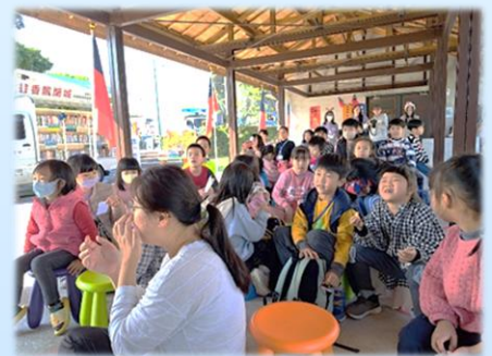
要準備圖書館九宮格闖關活動了

在巧妙的主題延伸安排之下，圖書館九宮格闖關活動，就開始由閱讀漸入「悅讀」了。冰淇淋媽媽和美兒姐姐負責抽籤問答，冰淇淋姐姐負責摺紙和彩繪，行動書車負責提供書籍，書車叔叔也為每個同學準備了小禮物，並引導孩子們認識樂齡書坊、兒少書坊、行動書車及電子書業務，雪碧姐姐負責圖書館打卡拍照等行銷闖關，而糖果姐姐負責解答問題，每個關主各司其職也相互搭配，就是要再一次加深同學們對圖書館的印象，進而走入圖書館，不僅身體閱讀也心靈閱讀。