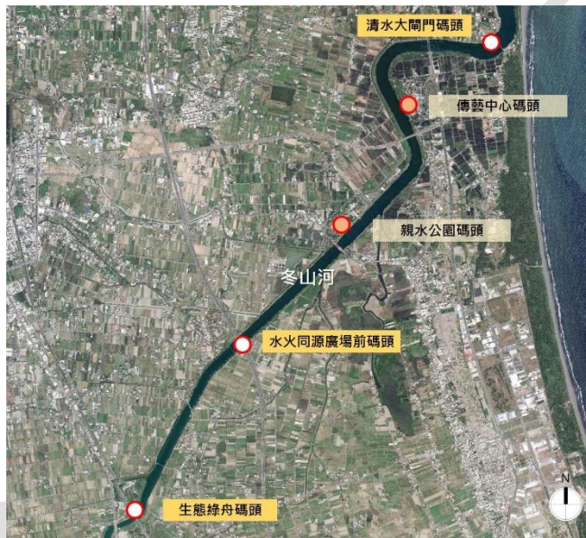
圖 1 主河道範圍圖

BOT 範圍為清水大閘門碼頭旁公有土地面積約 5,400 平方公尺，屬非都市土地風景區內之遊憩用地，土地所有權人及管理機關皆為宜蘭縣政府。