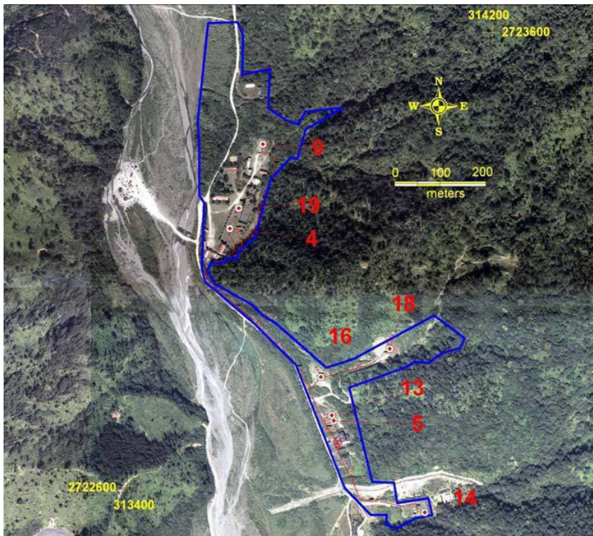
(圖 1) 地熱井孔位置