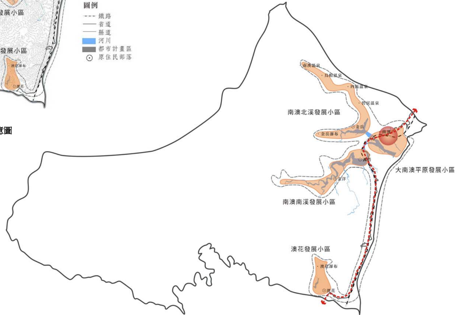
圖 6-48 南澳原鄉文化暨有機農業發展帶小區發展示意圖