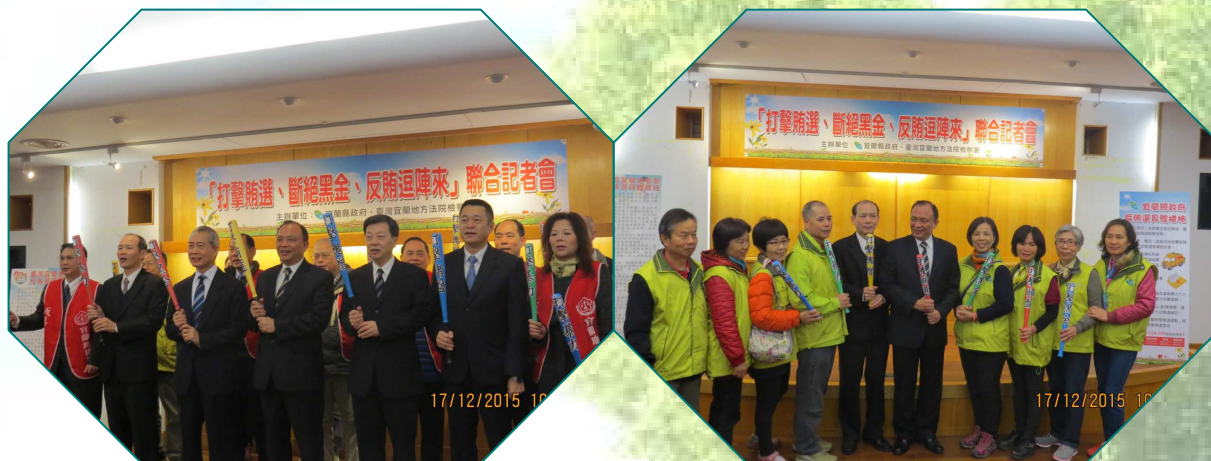
志工團體齊心「打擊賄選、斷絕黑金」作伙逗陣來

本次聯合記者會以生動活潑方式呈現，讓反賄選宣導行動具有互動性與啟發性，希望將反賄意識潛移默化形成縣民共識，認知賄選對社會未來及民主法治的危害，使反賄選工作成為社區化的全民運動，更以檢舉賄選專用信封積極抓賄或提供等額獎金鼓勵民眾檢舉多管齊下，期使在縣民共同監督下進行一場乾淨與公平的選舉，樹立良好的民主典範。