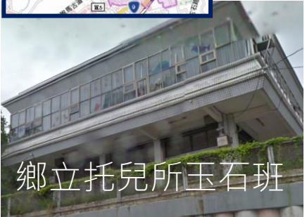
鄉立托兒所玉石班

鄉立托兒所玉石班 面積：63 平方公尺 容納：20 人 地址：公園路 2 號 電話：03-9882554