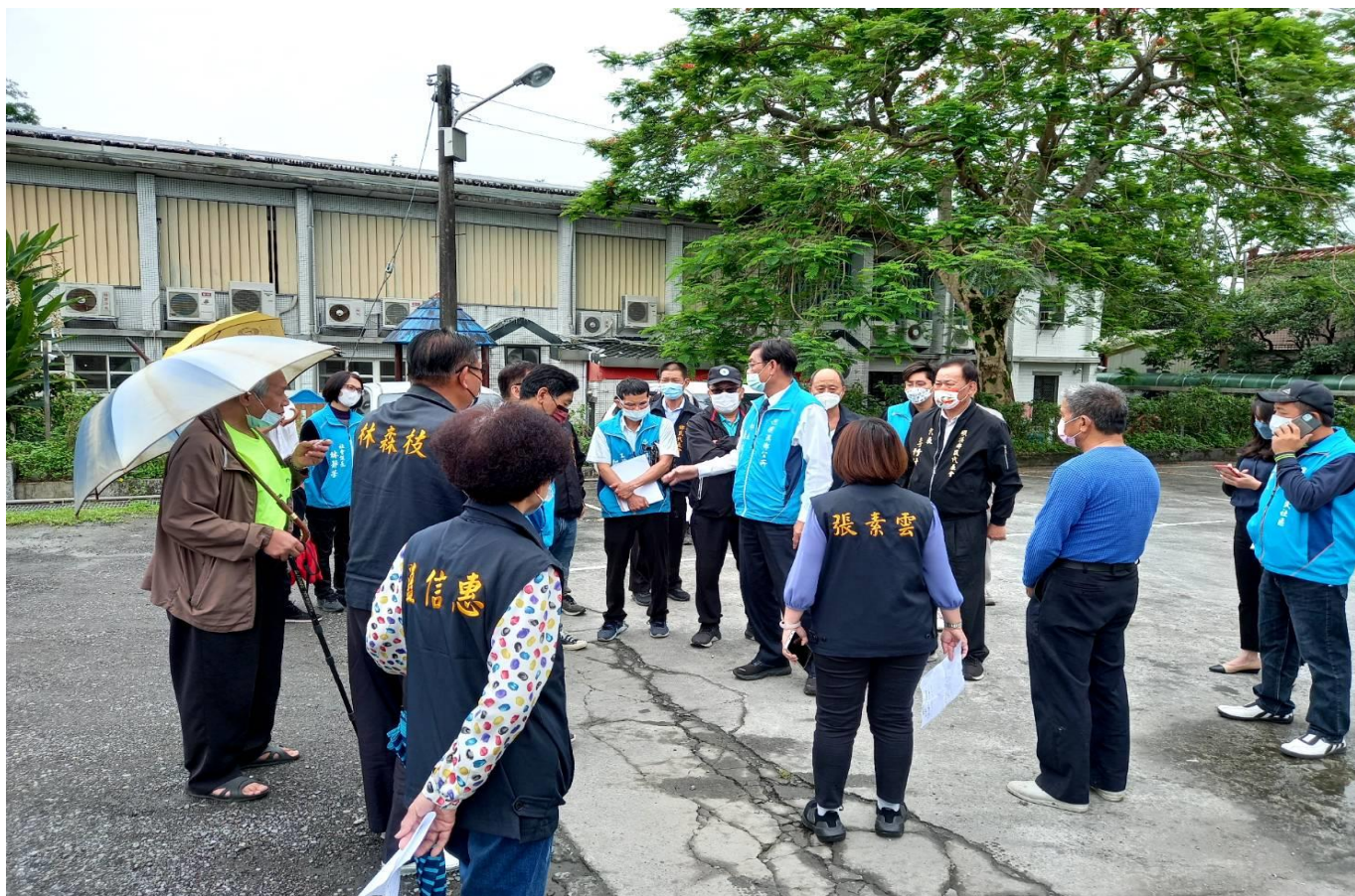
三民社區活動中心前廣場會勘：