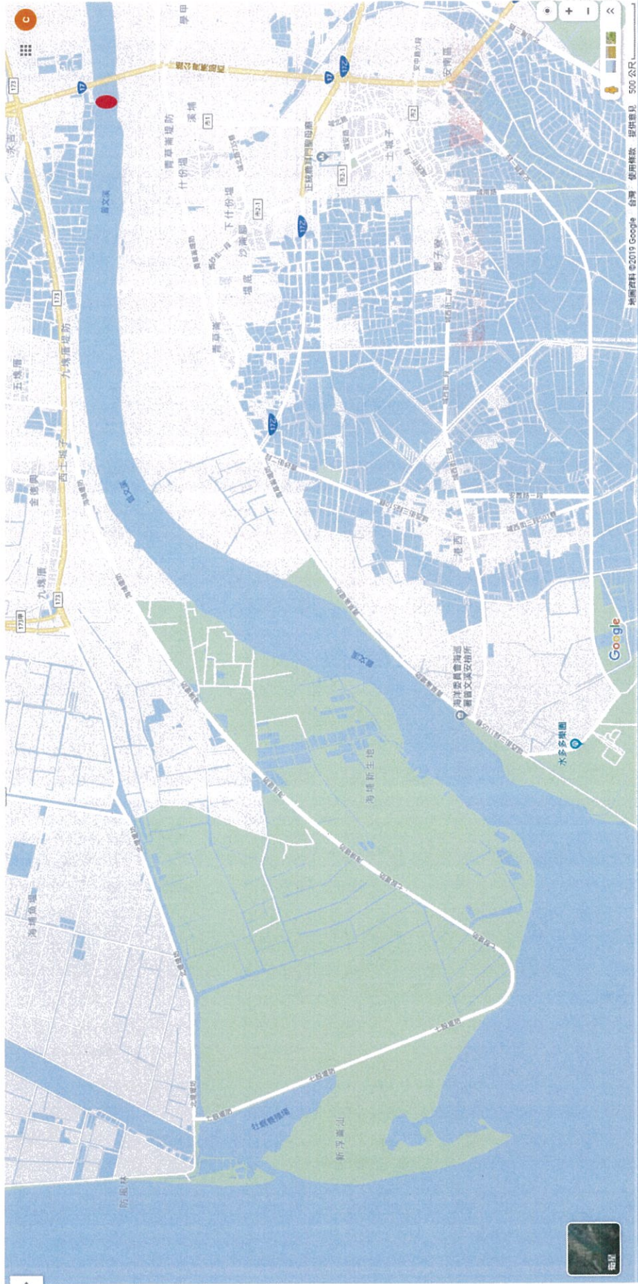
查獲地點：●國姓橋西方 100 公尺。