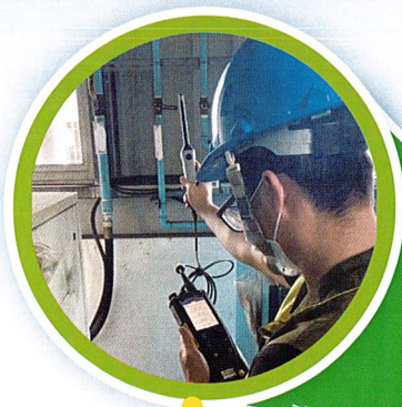
設備機房溫度檢測