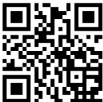
宜蘭縣社區規劃師駐地輔導計畫 網站 QR code