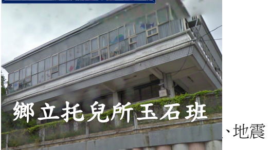
鄉立托兒所玉石班 10公尺以上海嘯