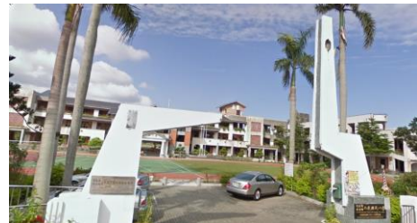
宜蘭縣政府消防局、礁溪鄉公所 111 年 1 月更新

三民國小 面積：851.41 平方公尺 容納：180 人 地址：礁溪鄉十六結路 100 號 電話：03-9982271 適用災害類別：水災、土石流、地震、5 公尺以上海嘯