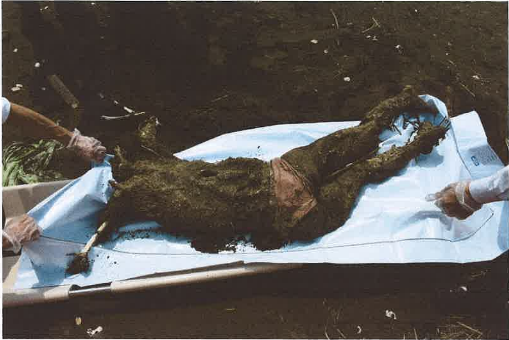
發現現場-無名屍全貌