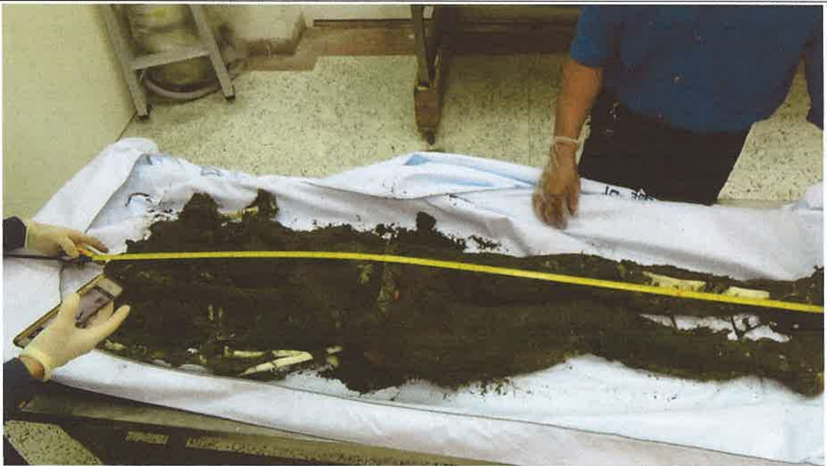
相驗-無名屍全貌、軀幹長約 154 公分(無頭顱)