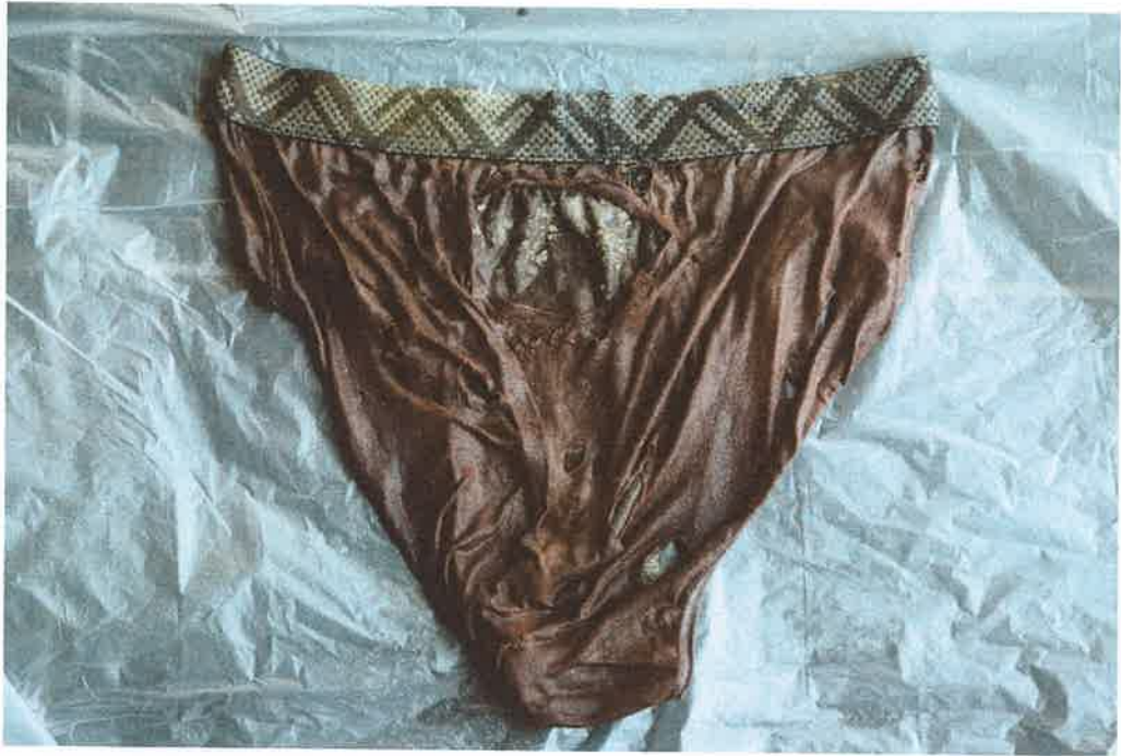
下半身穿著-紅色內褲