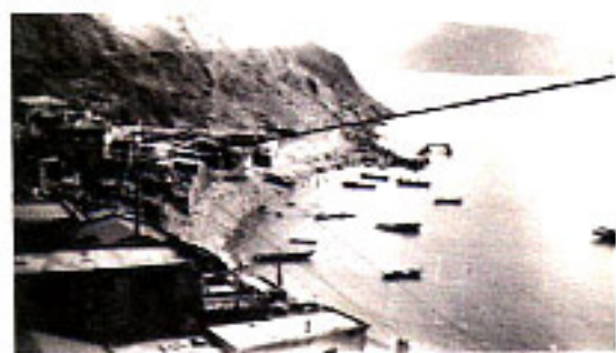
北方澳大澳