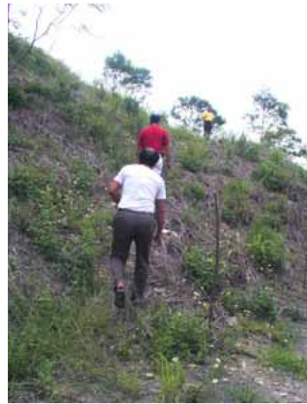
→ 牽罟路經過沙崙仔

沙崙占地約十公頃，最高廿三公尺，最低五公尺，從上頂寮一直綿延到下城，沙崙上有原生種的木麻黃、茄苳、黃槿、苦苓、月桃、野百合花等。