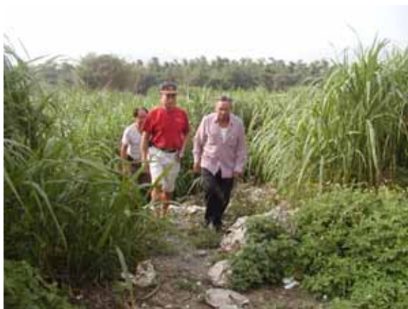
↑ 往大坑罟的功勞埔路仔經過溪床

頭前溝仔的上游是「窟仔底」，加上「三角地」，有田二甲多，林家人住那裡，竹圍很茂盛，沼澤區的水也是流入頭前溝仔。