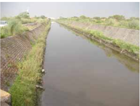
↑ 龍德工業區排水道有一段原本是頭前溝仔