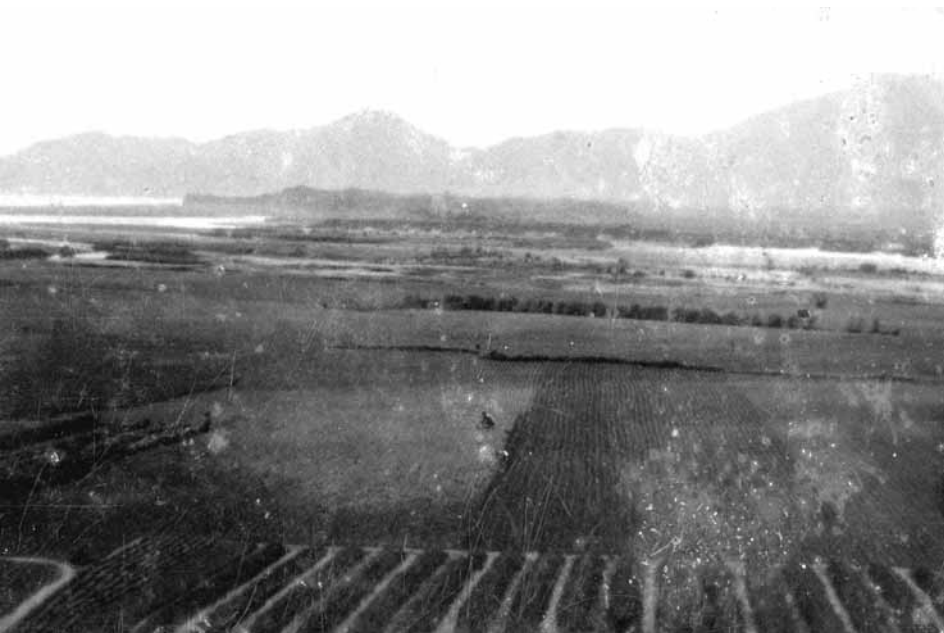
← 新城溪出海口田園