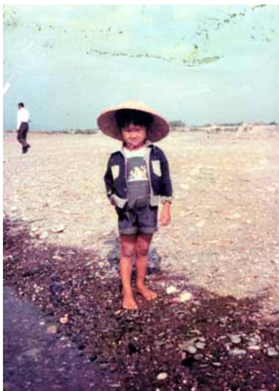
↑新城溪旁