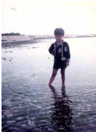
↑ 新城溪出海口

潮信條云：蘭海自號柳鼻山至蘇澳一帶，南去萬水朝宗，洋面不遠，每月日辰，潮水長退，皆有異於通台各處。