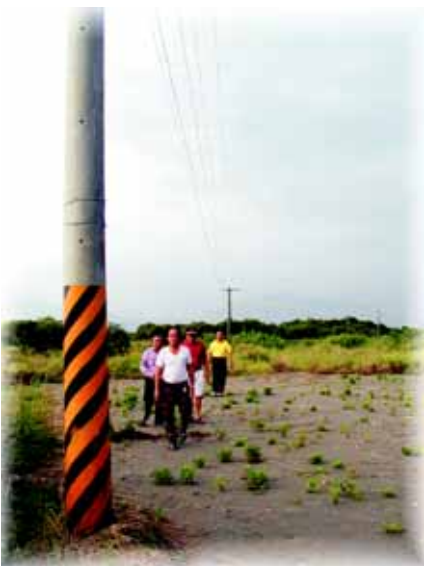
← 電火條仔路仍可見到整排的電線桿