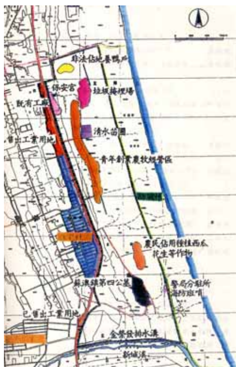
↑ 利澤工業區開發圖 工業局

沙丘以東，是一道防風林，樹帶寬150—210公尺之間，樹種以木麻黃為主，日據時代開始大舉栽種，嚴禁入內樵採，林木茂密，是防風、防沙的屏障，現在的木麻黃樹，多種於光復之後，樹齡在20年左