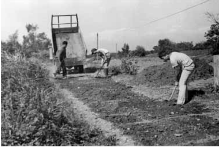
↑ 庄民出「公工」整修頂寮路