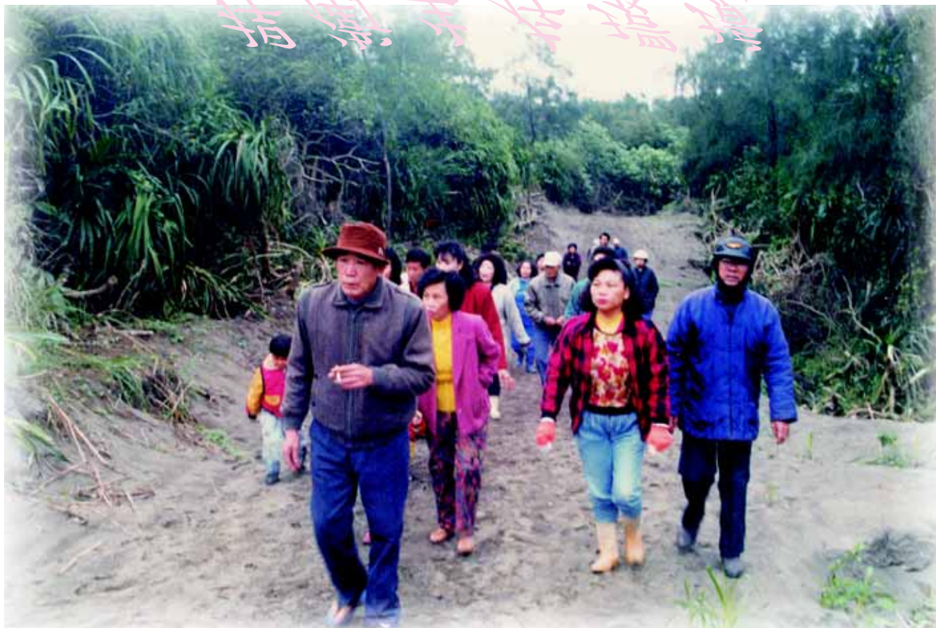
↑ 里民趕往防風林阻止垃圾場動工

龍德工業區設立之後，原本清澈的河水變成毒水，原本甘甜的地下水，漂浮一層黃油，散發出腥味，再也不能泡茶，工廠排放的五色煙霧，隨風飄散，日夜臭氣沖天，令人頭暈目眩，從此，頂寮里民對自然環境的依存，有了徹底的覺悟。