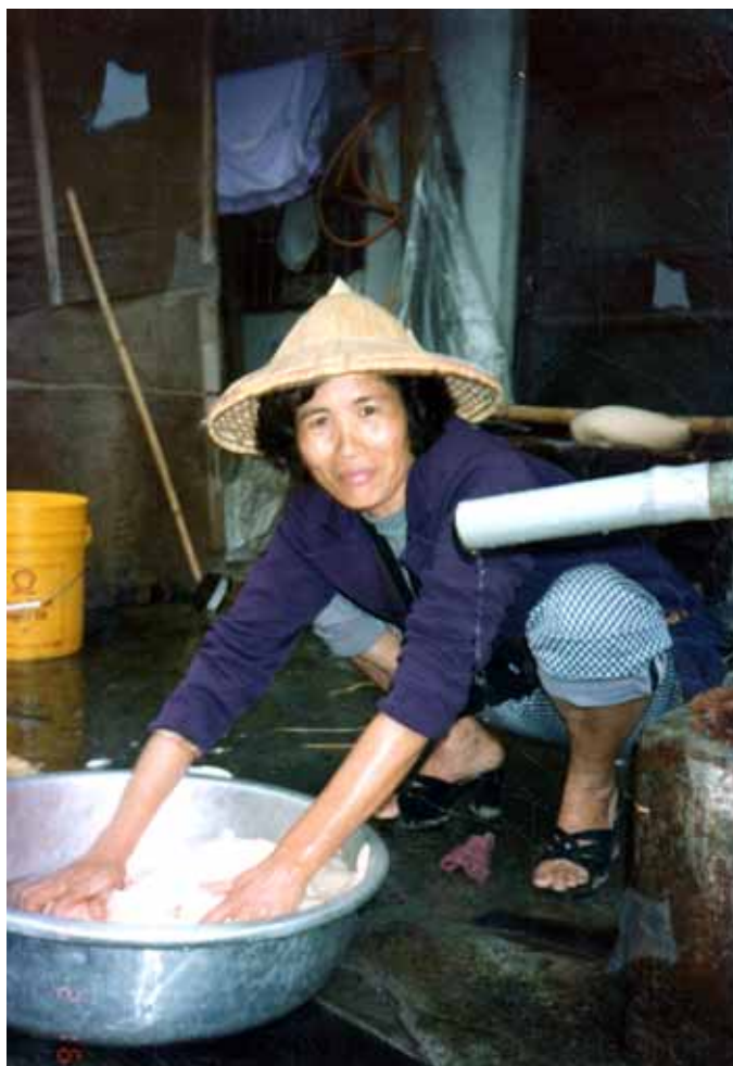
→ 年節女人家忙著做糰

抗爭不成，退而求其次，多要些回饋，造福鄉里，也是理所當然，近年來，社區分配到的回饋金，金額並不大，按計畫執行小型建設，沒有分給家戶，主要是避免爭議，避免惹上官司。