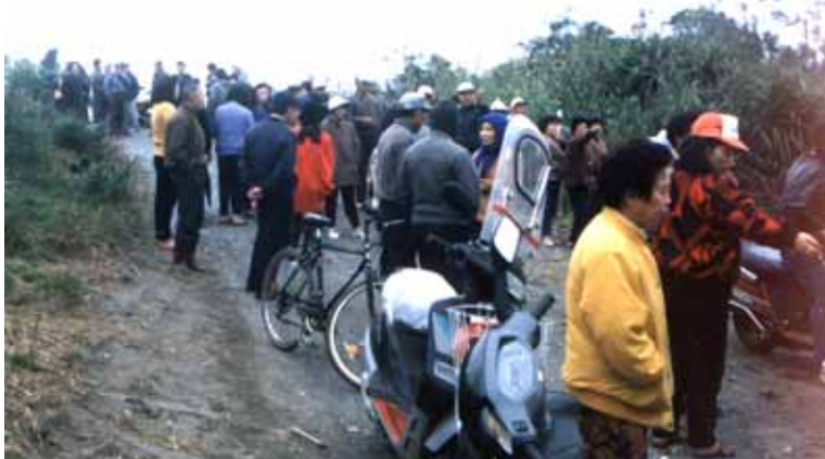
↓ 趕來阻止垃圾場施工的里民被警察擋在工地外

阻止施工失敗，情緒沸騰的里民，決議到縣政府「輸贏」，頂寮、龍德、成興三地居民，齊集國聖廟，下午一時卅分，聚集了七百多人，因為交通工具不足，其中健壯的三百多人，帶著雞蛋，分乘四部巴士，前往縣政府抗議。