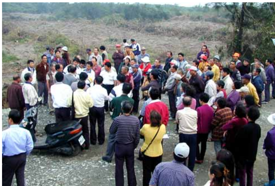
← 聞訊趕到的里民阻止五結垃圾場動工