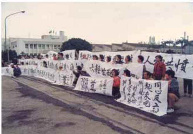
↑ 反工業污染頂寮人不缺席

對六輕設廠，頂寮人本來沒有既定立場，只是以自身的慘痛經驗，不相信「零污染」這種神話，頂寮人投入反對，幾乎是無役不與，直到八十年，台塑宣布將六輕移往雲林麥寮為止，頂寮人盡心盡力。