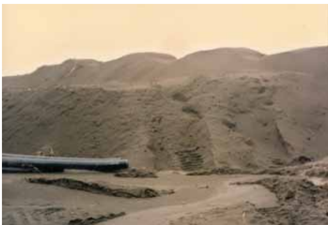
←工業區整地破壞小沙崙