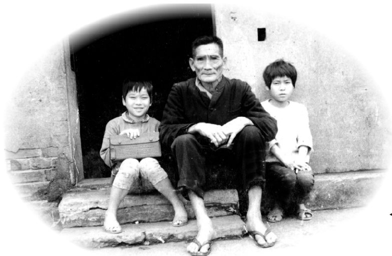
← 阿公閒來無事說故事給小孩聽