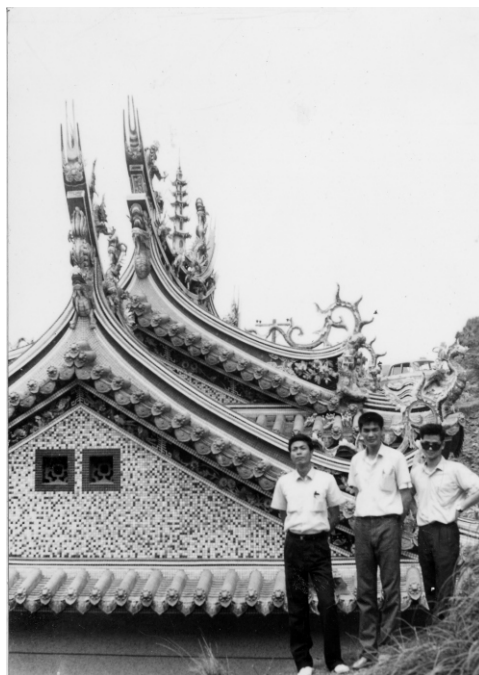
↑ 最後才搬遷的進安宮造型典雅

監察院、主計處、縣政府、縣議會、南成社區發展協會、自救會，各有不同見解，迄九十二年五月，還沒有具體結果，遷村前後三十年餘，仍未塵埃落定。