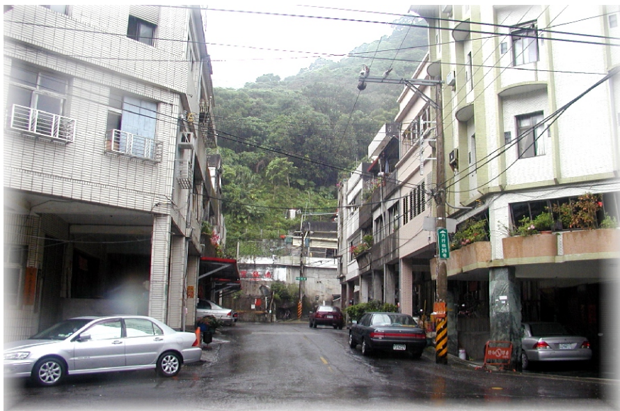
↑ 遷建南方澳南成里的北濱一村

龍淵計畫，始於民國五十八年（一九六九），計畫將北方澳一百五十八戶，全部遷走，選定的安置地點，分別是南安國小舊校址、內埤防波堤堤頂省有公地，當地原本已有零星住戶。