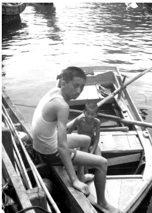
↑ 兄弟上船戲耍 (攝於大澳海面)

縣議會也展開調查，八十九年六月四日，在南方澳昭安社區召開會議，決議貸款利息，涉及民法「阻卻事由，時效中斷」，建請營建署免收。貸款戶違約金，土地銀行同意免收。龍淵計畫有四成補助款下落不明，另專案調查。已查封房屋不得拍賣，未查封房屋不得查封。