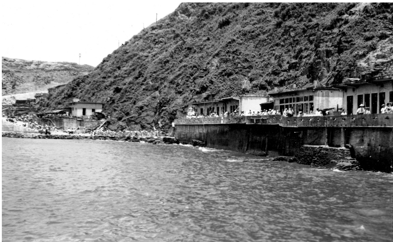
↓ 從海上看媽祖千秋迎神隊伍