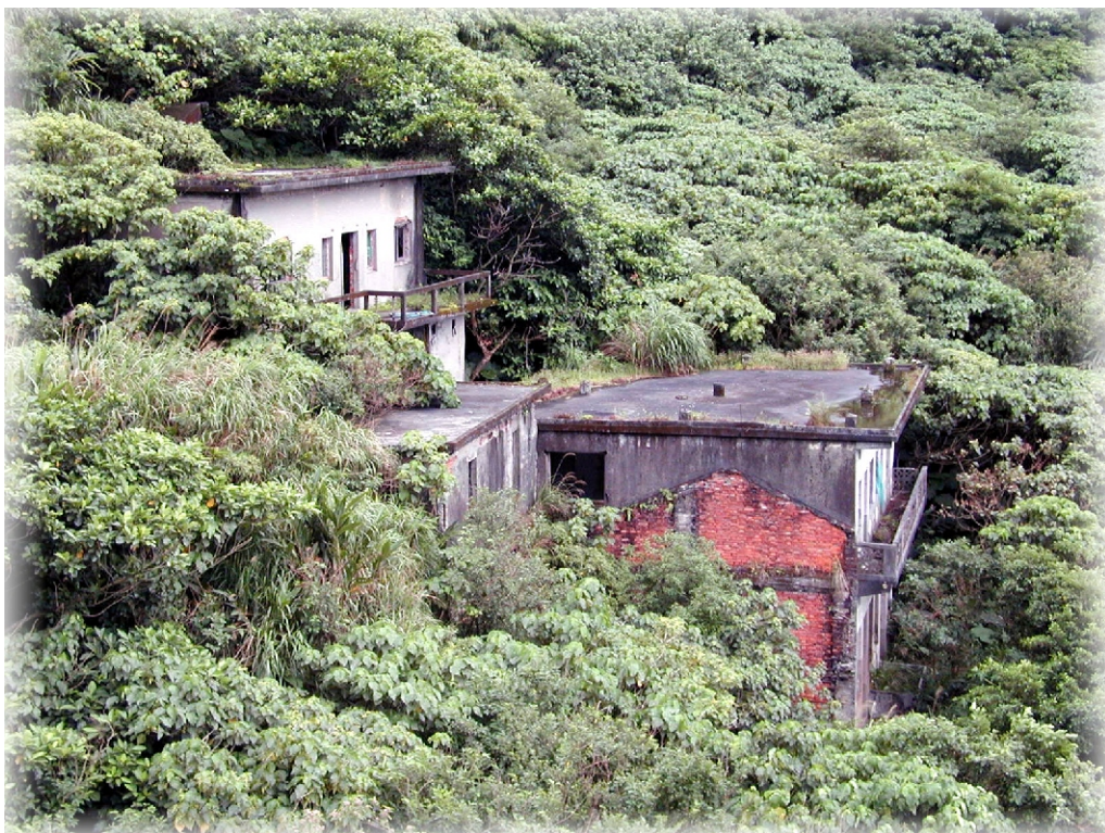
↑ 遷村後部份未被拆除的建築物若隱若現

龍淵計畫，改變了北方澳人的命運，人口、牲口，全部遷出，從此，北方澳成了軍事要塞，北方澳人成了南方澳人。