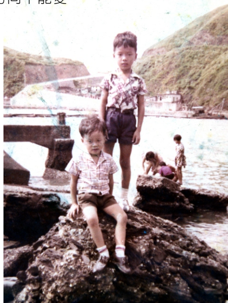
↓兩兄弟在日據時代廢碼頭旁的礁石上玩

專案執行小組第六次會議決定，遷建工程發包、訂約、施工、監造、驗收等，均由遷建會自行負責，住宅興建工程發包後，結構面積不能改變，外表、形式、材料不能變，樓梯、廁所、廚房位置不能變，排水溝之大小及排水方向不能變。