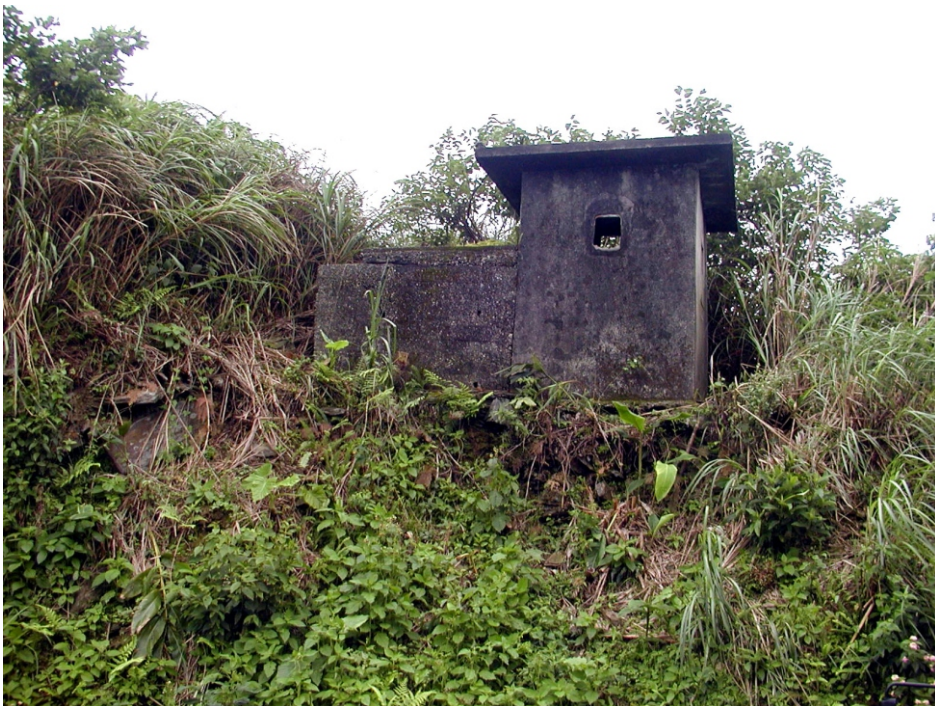
←松尾坑上的廢棄崗哨

南關與蘇澳一嶺毗連，易於稽察也，至今尚未議准奉行。道光十五年，又議於蘇澳建砲台一座，官民捐修，尚未告竣。