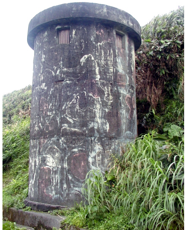
↓ 軍方使用的舊水塔

日本明治維新，覬覦台灣，先後派人來台潛伏，刺探清廷虛實，一八五〇年，幕府大臣西鄉隆盛從東港（蘇澳）上岸，偽裝成漁民，住在南方澳，四出打探。一八七三年，台灣第一任總督樺山資紀（時官拜少佐），奉西鄉隆盛之命，潛伏來台，也住南方澳，打探沿海的清軍佈署。