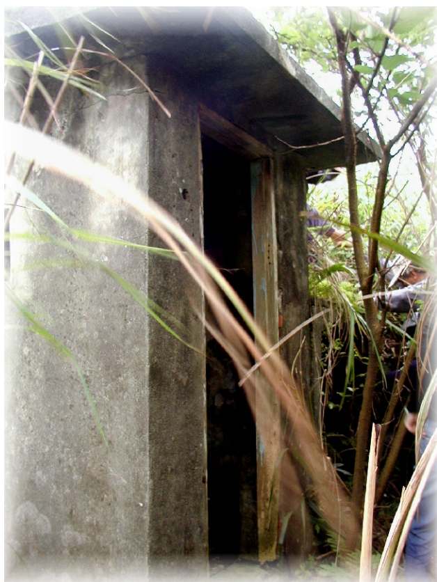
↑廢置碉堡被雜草包圍

宜蘭縣誌勝跡篇：「南關遺址今已無存，一說在蘇澳聖湖里，一說在七星山麓」。民國四十二年修纂的宜蘭縣誌：「距議建南關一百零一里，已不知南關確實位置」。