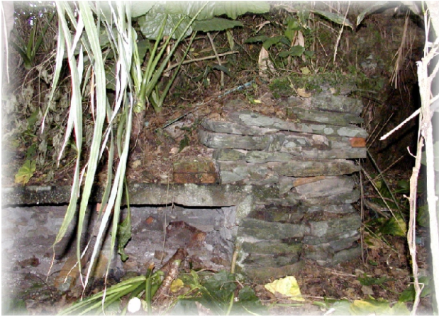
↑ 傾毀的加強磚造工事

，六十六年四月一日貫穿，在此以前，松尾坑步道，是蘭陽平原最南端的新馬平原（東勢盡頭），進出施八坑（蘇澳）的孔道，陸路上，也是軍事要衝，居於鎖鑰地位。