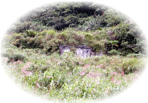
↑北濱國小如今只剩一面殘壁

大澳的學生較多，低年級只上半天課，全校只有二位老師，事實上，一天只上一、二個小時課，學生經常溜出去玩。