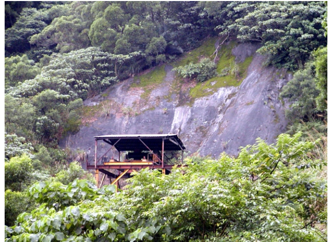
↑ 蘭陽隧道豎井正位於松尾坑上