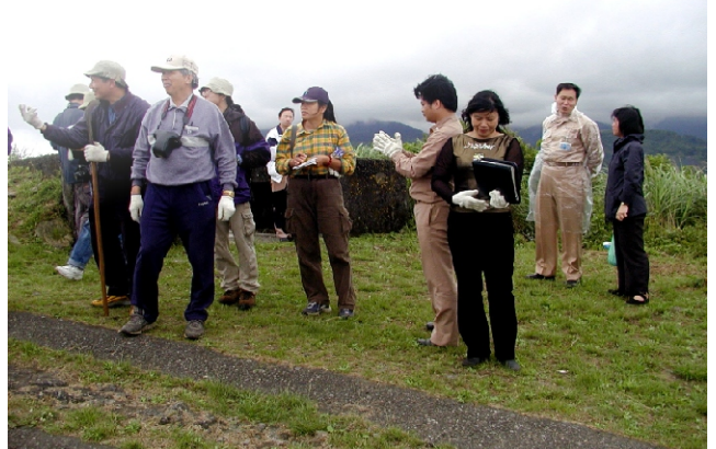
↓ 北方澳回顧探訪之行

所以，留下許多遺跡，有一條寬約一米的階梯，直達基地重要部門，靠山側，一座軍用大水塔，水塔上方有哨所。（請參考勝蹟篇與南關探索篇）