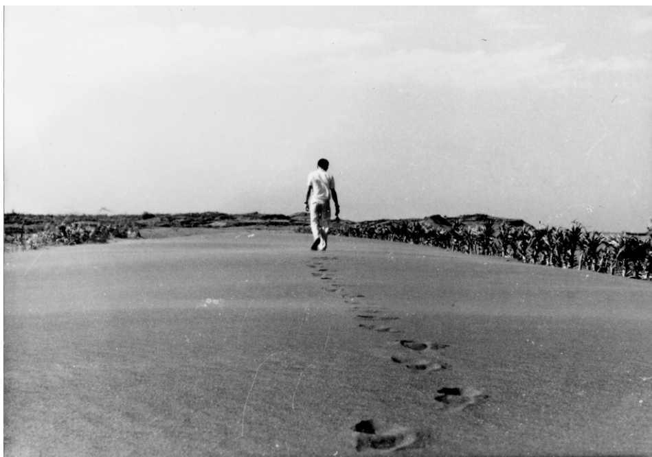
↑ 海岸內移前的澳仔角 沙灘棉長

北方澳嶺北邊嶺下，有港口、嶺腳、澳仔角三個聚落，「風坑仔」下方是嶺腳，往東是一處灣澳，古稱澳仔角，以前，生活上與北方澳息息相關。