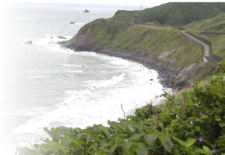
↑ 蝦仔澳是一處天然灣澳

滿載後將船開回大澳卸下，一天來回三趟，四天下來，捕獲二千多公斤，北方澳家家戶戶小賺一筆。