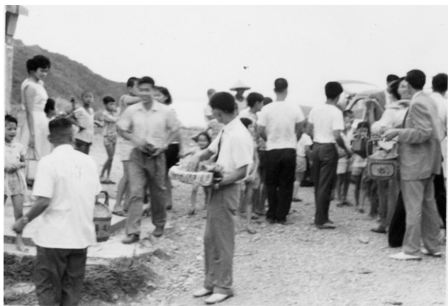
↓ 新娘禮車開到板牆 親友迎接新人

以前，北方澳人結婚多坐轎，轎子過板牆，一路往下走，又快又急，新娘擔心摔下來，一路緊抓轎子不放，尤其天雨路滑，更是難堪，稍不注意，喜餅、米香就掉滿地。