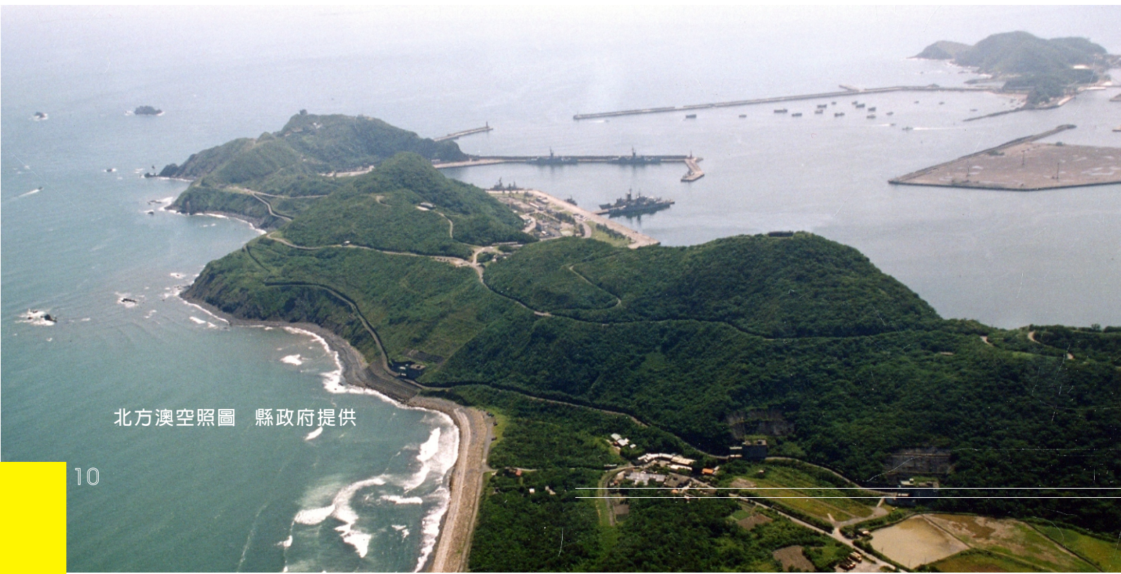
北方澳空照圖