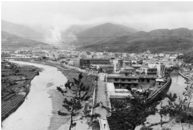
↑ 通往北方澳的昔日道路看得一清二楚

稱為埤角，是因為這兒有一個水陂，陂中水不乾，長滿水生植物，也是北方澳人重要水源之一。