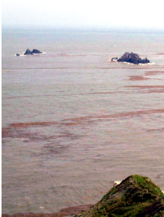
↑ 北方澳的三仙台

遷村前，漁船經過時，漁民偶而爬上去採笠貝，遇大漲潮，其中部份較小的礁石，看不清楚，行船經過，需得特別小心，避免碰撞；如今的北方澳三仙台，已很少有人知道了。