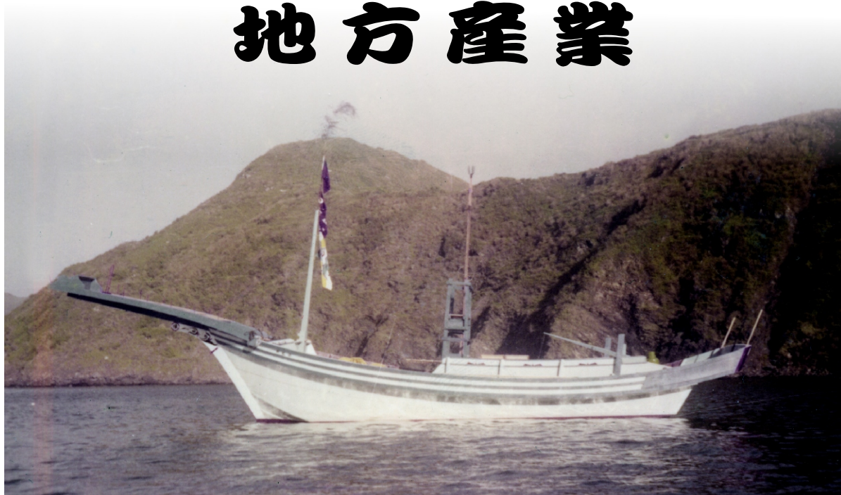
↑ 新龍榮號漁船試航

北方澳腹地狹小，海風強勁，無法種稻，居民靠捕魚為生，清朝以來，漁業就是最主要產業，漁家也養豬、養雞，但數量有限，不足自給。