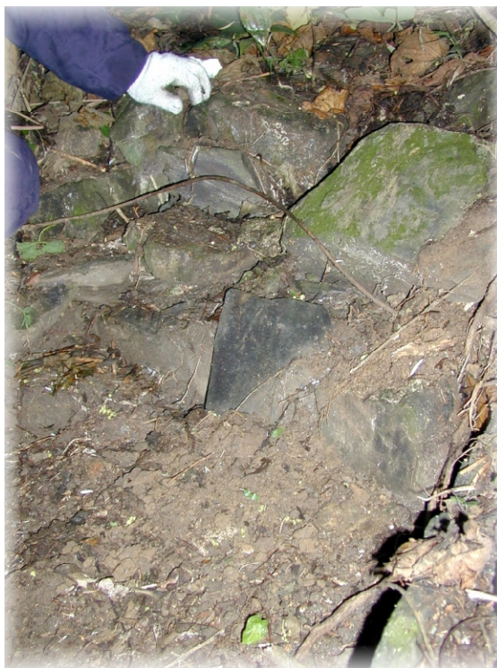
↑二百年前古墓，外觀只見幾片石板

三人果跚跚而來，村民上前質問，你們進庄來幹什麼？新竹人答，找人。找誰？一時卻答不上話來。