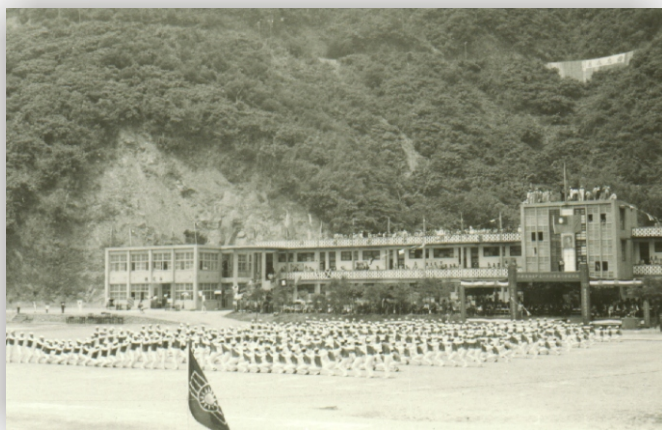
↑ 北方澳時期的蘇澳海事職校