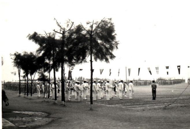
↓ 蘇海學生出操