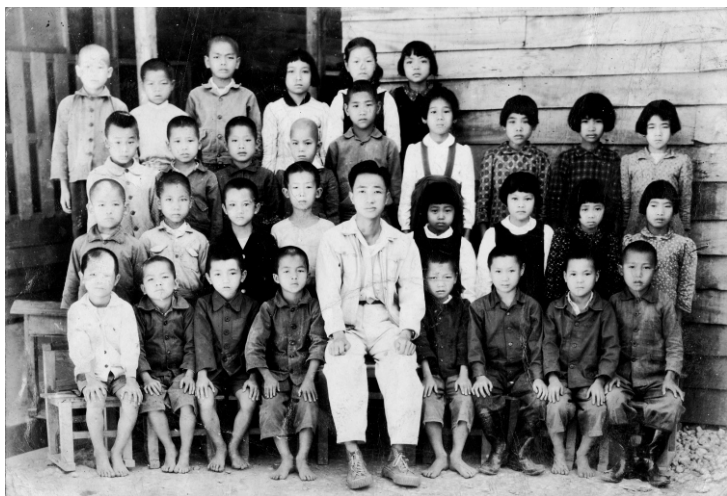
↑ 與老師在木板搭建的教室前合影

北濱國民學校，初期，借用海軍駐地的房屋和倉庫，四十年，蘇澳鎮公所發動地方熱心教育人士，籌款興建校舍，始具規模。