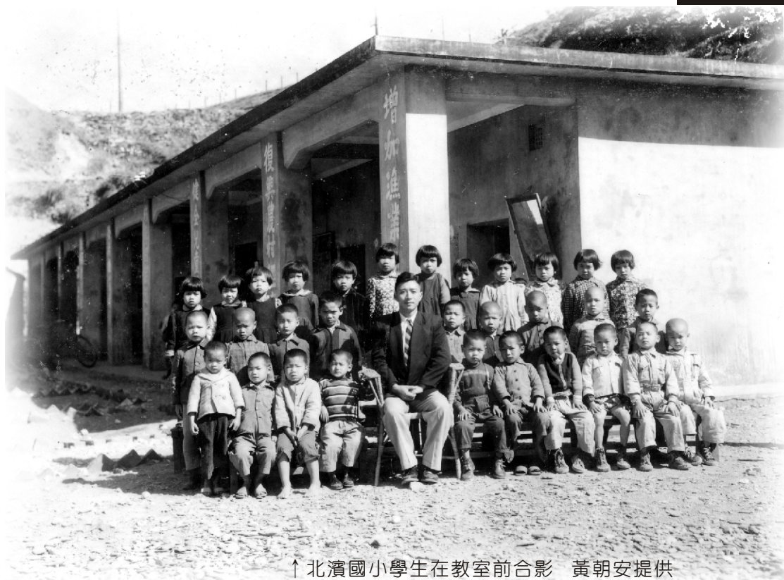
↑ 北濱國小學生在教室前合影

清治初期，蘇澳地方新闢，生計維艱，文化教育未受重視，直到同治十三年，提督羅大春捐銀五百圓生息，在張公廟內設立義塾，才有了正式的教育場所。