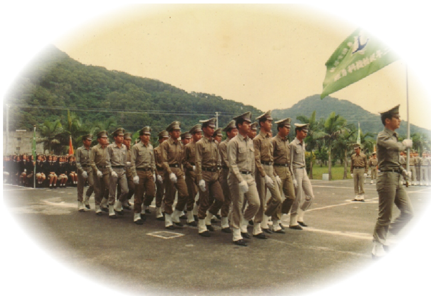
↑ 北方澳時期蘇海學生軍訓課