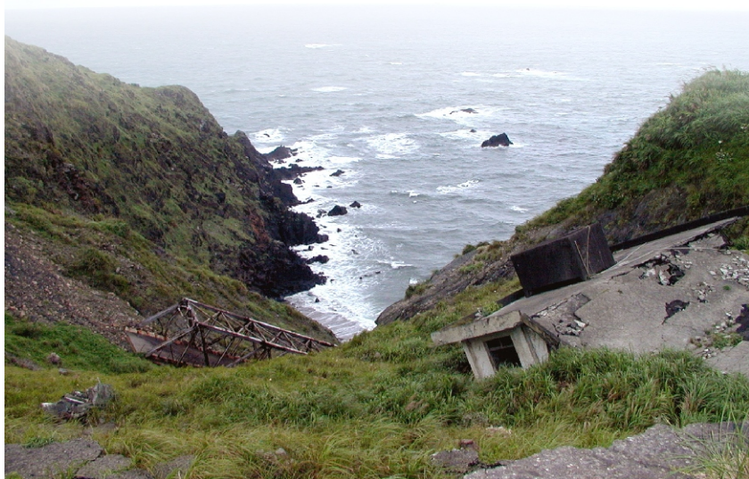
←南端峽谷地勢險要

查蘭地自入版圖以來，東勢一帶，民番常被生番殺害，南風盛發之時，又常有匪船寄泊澳內伺劫，易于藏奸，實屬要地，去城寫遠，最難防禦，似可就地設隘把守，內禦生番逸出，外護居民樵採，如遇匪船寄泊，亦可隨時飛報防守，以杜奸民私墾藏奸之念，似於地方實有裨益。