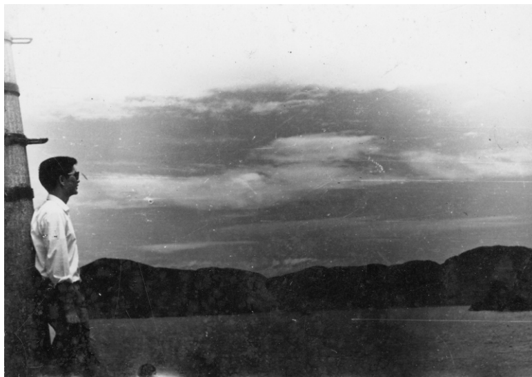
↑風雲變幻的北方澳

淡水廳志，附錄清姚石甫「改設台北營制議」云：馬賽草山之外曰蘇澳，接界生番，東臨大海，可泊大小百艘，昔蔡牽、朱潰二逆，屢泊舟於此，以窺噶瑪蘭。