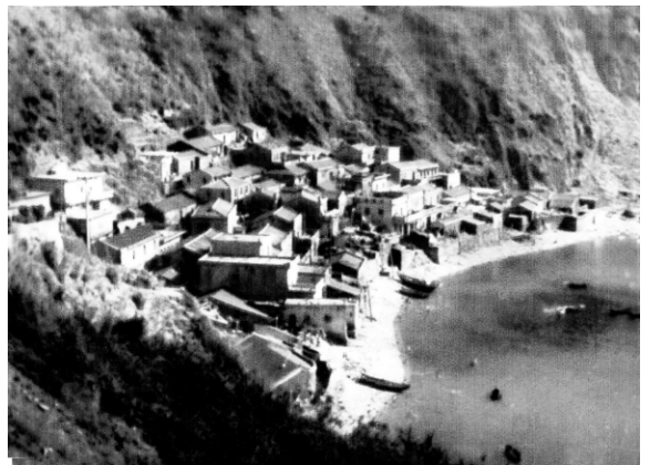
↑ 大澳全景