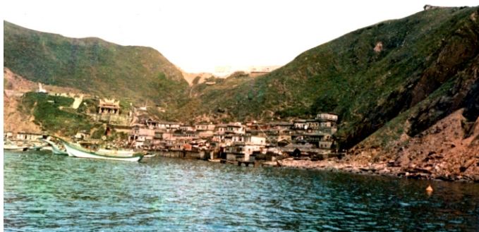
↑ 北方澳大澳一帶風光