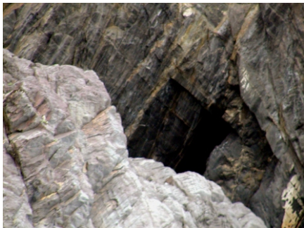
← ↑ 三孔口中的兩孔