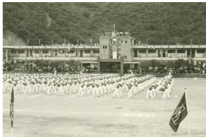
↑北方澳時期的蘇澳海事校慶