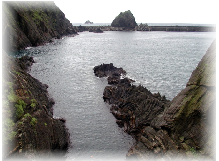
↑ 尖山之下正前方像鯉魚頭的是鯉魚礁

鼻仔頭是大、小澳的屏障，堅硬的花岡岩，聳立大海之中，任憑風浪拍打，始終守護著北方澳人，鼻頭內，和風吹佛，鼻頭外，浪花奔騰。