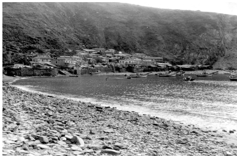
↓ 北方澳大澳