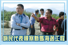
鎮民代表視察新馬海邊工程