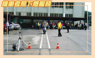
機車考照下鄉服務

本鎮定期有律師下鄉提供免費的法律諮詢服務，秉持耐心、積極態度解答民眾法律問題，使民眾能夠在法律保障的情況下爭取自身權益，深獲民眾肯定。