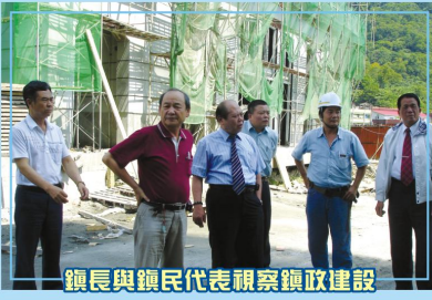
鎮長與鎮民代表視察鎮政建設