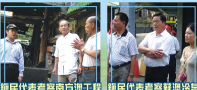
鎮民代表考察南方澳工程