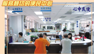
服務親切的便民中心

本所便民中心提供免費諮詢、代書、案件申請等服務，許多生活上的疑問，都可在此得到解答；此外也設有就業服務台，提供民眾就業諮詢服務，不少民眾因此得到穩定的工作。