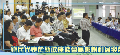
鎮民代表於縣政座談會為鄉親利益發聲