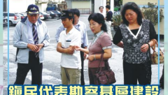
鎮民代表考察蘇澳冷泉