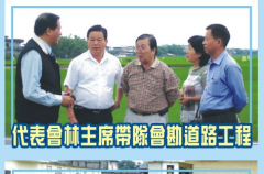
代表會林主席帶隊勘測道路工程