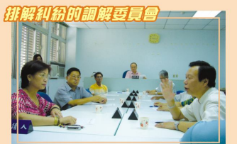
排解糾紛的調解委員會

本所自96年10月開設地政便民工作站，民眾申請各類地籍謄本不須舟車勞頓至羅東地政事務所辦理，開辦以來已完成萬餘件謄本申請，大大節省民眾的時間與金錢。