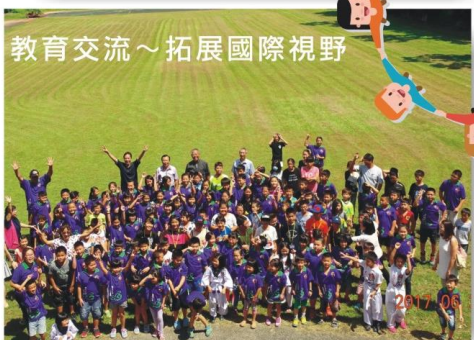
教育交流~拓展國際視野