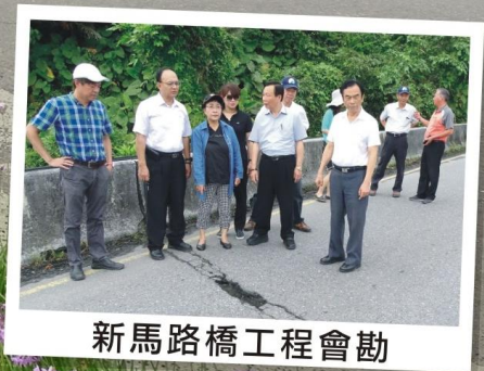
新馬路橋工程會勘