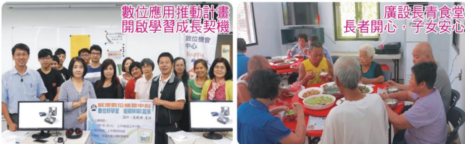
數位應用推動計畫 開啟學習成長契機

立幼兒園教學環境、設備，並設置高畫質數位監視系統，以維護幼童校園安全。綜上措施，期以對弱勢族群之關懷，進行全面照顧，極力推動有感施政。