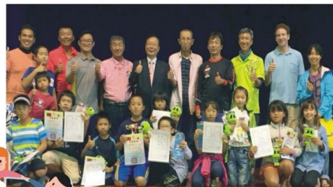
岳明國小師生與石垣市帆船交流