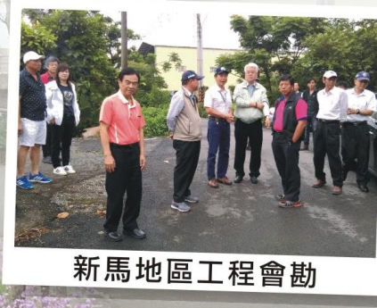
新馬地區工程會勘