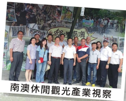
南澳休閒觀光產業視察