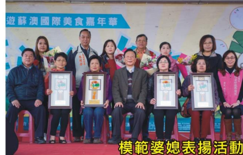
模範婆媳表揚活動