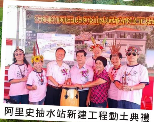
阿里史抽水站新建工程動土典禮