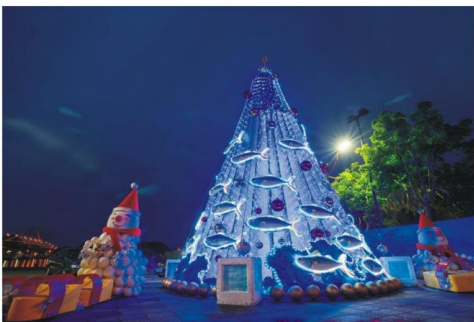
裝置藝術~創意街景佈置

為迎接農曆新年，公所別出心裁在鎮內重要路口節點及公所廣場，運用現有景觀和在地特色，以祈福年樹、平安橋及特色花布燈籠為搭配主題，創造新年拍照打卡新熱點，為設計主軸，祈求平安、迎好運。