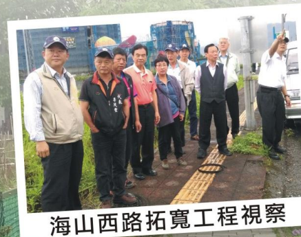
海山西路拓寬工程視察