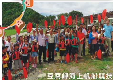
豆腐岬海上帆船競技