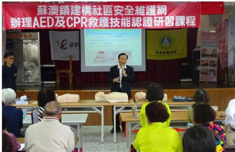
蘇澳鎮建構社區安全維護網 辦理AED及CPR救護技能認證研習課程

為因應天災及劇烈氣候變遷，加強各項防災整備及人員訓練，以有效達到防災、減災及救災的目的。此外，為預防現代人文明病~三高及心血管疾病盛行，於社區辦理 AED (自動體外心臟除顫器) 及 CPR (心肺復甦術) 技能，培訓社區在地居民具備自主救護之能力，許給鎮民一個安全無虞、健康快樂的生活環境。