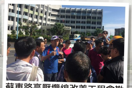
蘇東路高壓纜線改善工程會勘