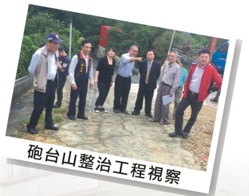
砲台山整治工程視察