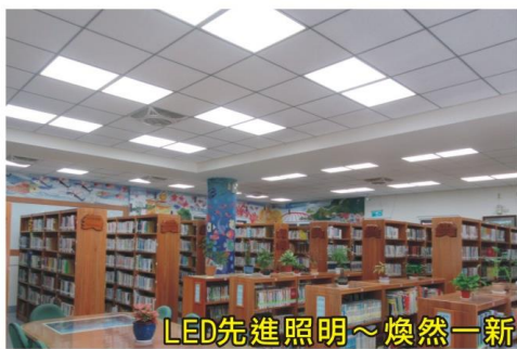
LED先進照明~煥然一新