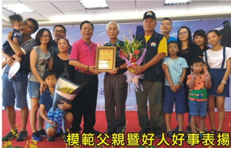
模範父親暨好人好事表揚