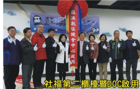
社福第二櫃檯暨DOC啟用