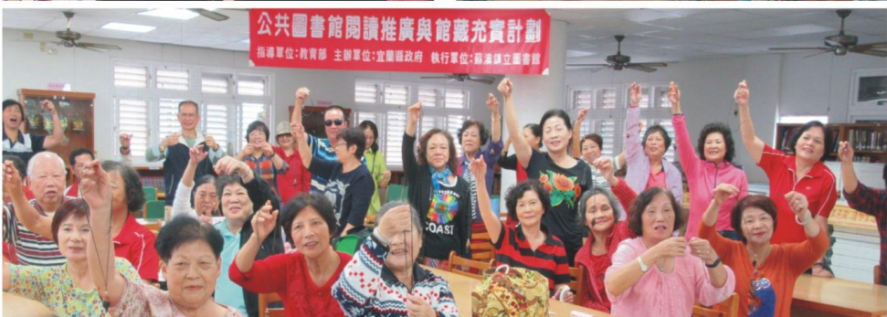
公共圖書館閱讀推廣與館藏充實計劃