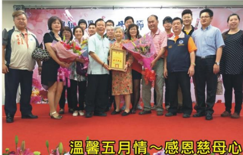
溫馨五月情~感恩慈母心

2017模範母親、模範父親、模範勞工、模範婆媳、優秀青年及路燈認養表揚，為肯定各行各業堅守崗位，對家庭、社會的奉獻，促進社會繁榮進步，藉由表揚活動，感謝他(她)們的辛勞與付出。