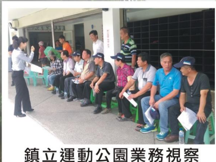
鎮立運動公園業務視察