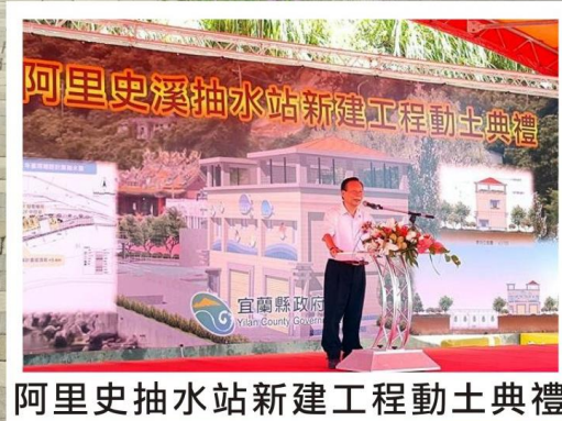
阿里史抽水站新建工程動土典禮