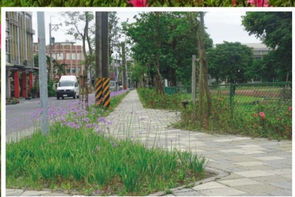
鎮公所與里長-代表等地方人士下鄉會勘集錦