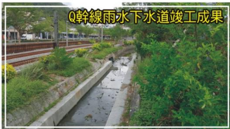
Q幹線雨水下水道竣工成果