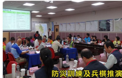
防災訓練及兵棋推演