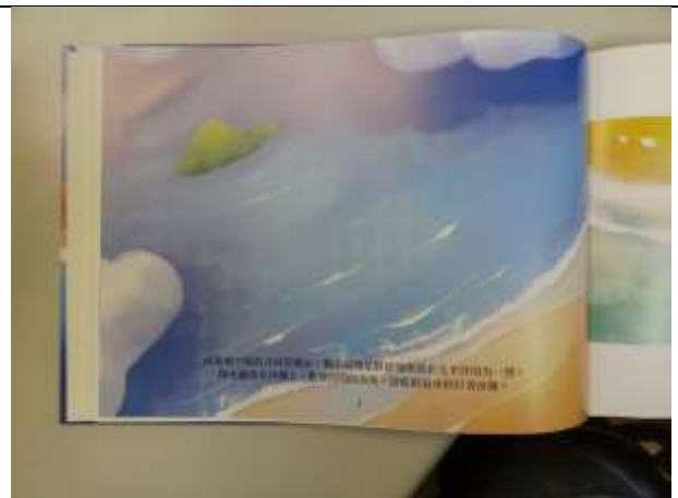
橫式內頁 第 1 頁(從左側開始)