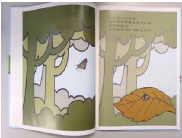
直式內頁 第 1 頁(從左側開始)