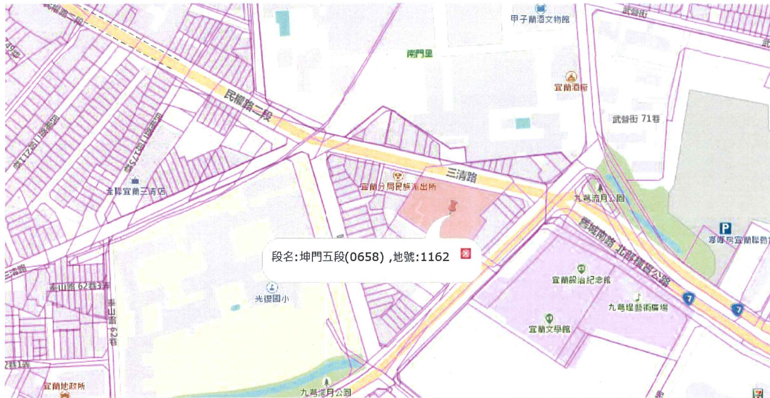
標售土地概略位置圖(宜蘭市)