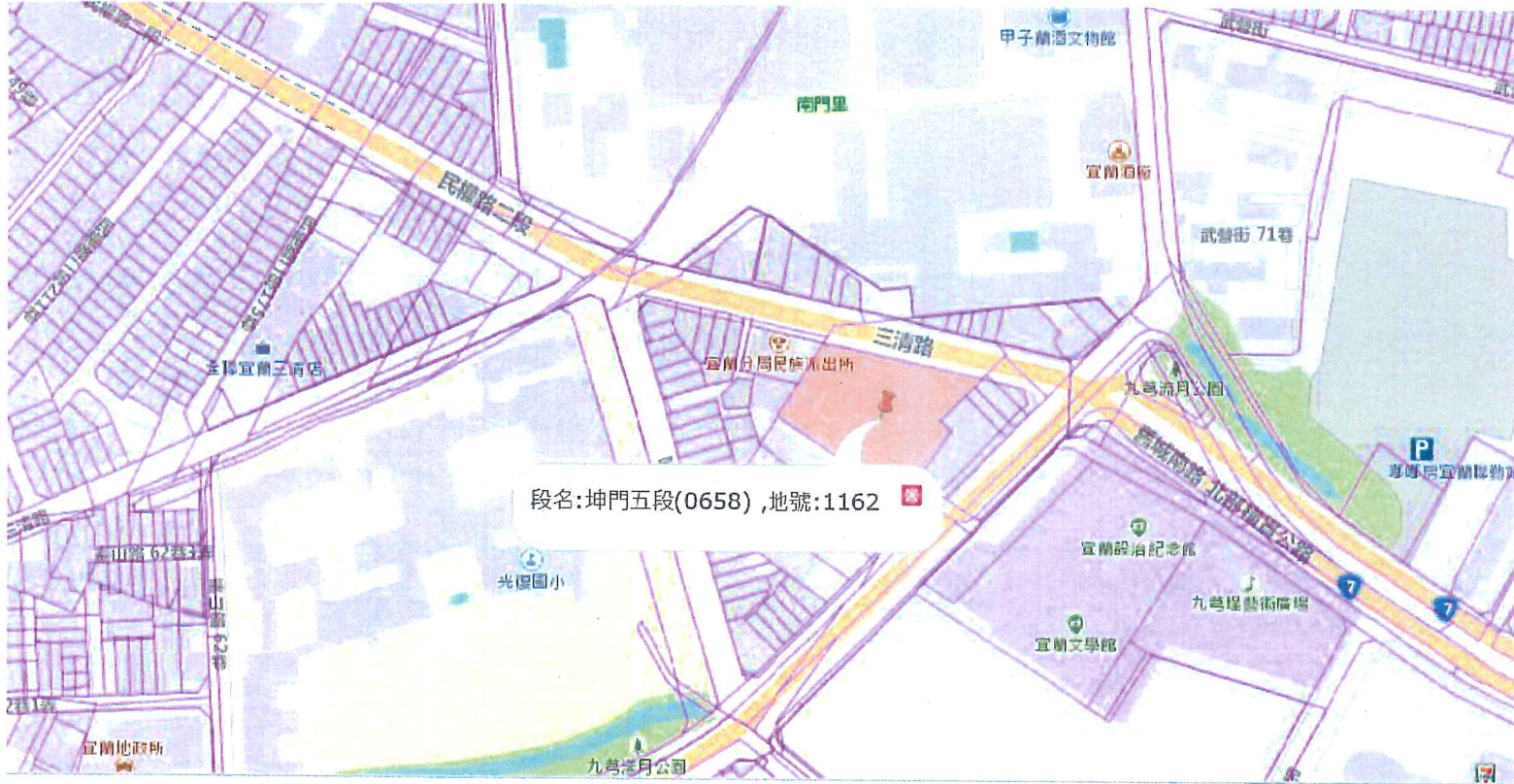
標售土地概略位置圖(宜蘭市)