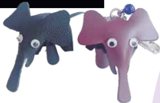
皮革吊飾鑰匙圈禮盒