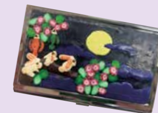
軟陶名片盒- 慶祝中秋節

9.2cmX5.7cmX0.7cm 可放置名片大小9cmX5.5cm， 約可放20~25張名片 軟陶作品皆由軟陶土調色