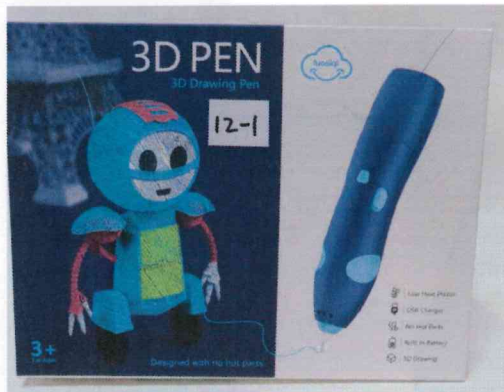
美勞玩具 3D打印/勞作筆