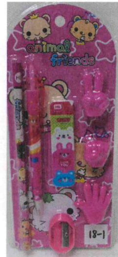
文具附加玩具 猜拳遊戲文具組