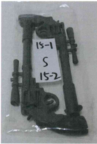
本體本身具玩耍功能 仿真玩具槍筆