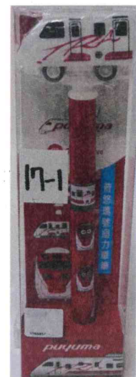
文具附加玩具 交通工具玩具筆