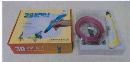
美勞玩具 3D打印/勞作筆