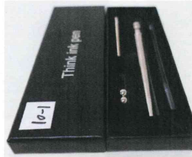
文具附加玩具 附加巴克磁球組合玩具筆