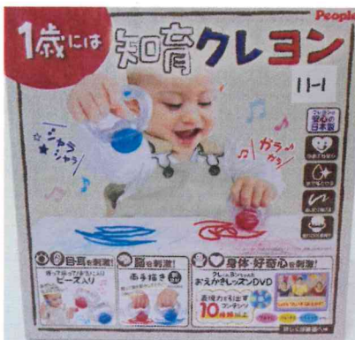
文具附加玩具 手搖鈴蠟筆