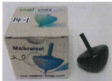
文具附加玩具 陀螺筆