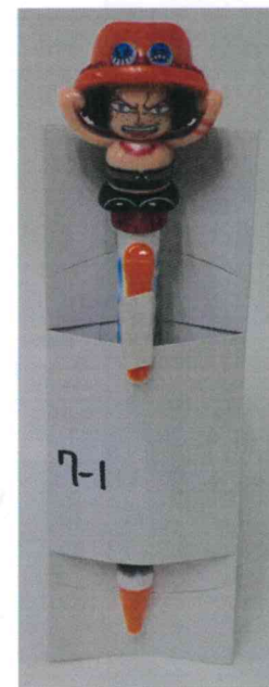
本體本身具玩耍功能 指尖陀螺筆