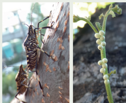
欒樹樹幹上的黃斑椿象(成蟲)及卵(通常為12粒且孵化前會出現黑色箭頭)。