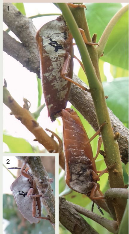
1. 交配中的荔枝椿象老成蟲，上雌下雄，蠟粉明顯變少，露出褐黃幾丁質皮膚。 2. 荔枝椿象新羽化成蟲，腹面明顯具白蠟，胸部黑色區域為臭腺開孔(左右各一)。

荔枝椿象的若蟲體色鮮豔橙紅，成蟲則為黃褐色，胸部腹面披白色蠟粉，每次產14顆卵，羽化後成蟲於秋冬時會飛離臺灣欒樹及無患子，在部分龍眼樹葉背下棲息越冬。