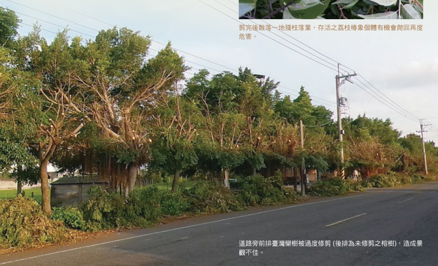
道路旁前排臺灣樂樹被過度修剪(後排為未修剪之榕樹)，造成景觀不佳。