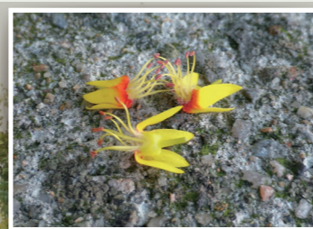
繽紛落地欒樹雄花。

臺灣欒樹是臺灣常見的行道樹，近年來種植的數量龐大，以臺北市為例根據2018年臺北市行道樹路燈資訊網 ( https://geopki.gov.taipei )至少有6,399株臺灣欒樹，佔總數量(87,806株行道樹)7.29%，在許多行政區幾乎是名列前茅。隨著時序變化，九月會開出黃色花序，雄花落地繽紛，中性花則經授粉後於十月開始結果，並且膨脹成氣囊狀如同紅色小燈籠般掛在樹梢，冬季時葉片由綠轉黃並逐漸凋零稀疏，可觀其蕭瑟之美。四季分別展現不同的色彩變化，因而有「臺灣金雨樹」、「燈籠樹」、「四色樹」等俗稱。