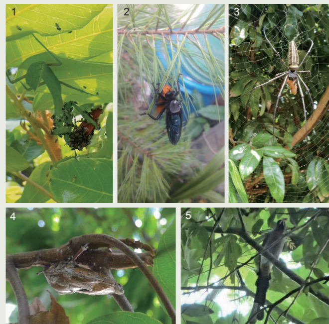
1. 螳螂。2. 大琉璃食蟲虻捕食荔枝椿象。3. 人面蜘蛛 ( Nephila pilipes )。4. 感染真菌而死亡的荔枝椿象。5. 樹鵲啄食荔枝椿象。