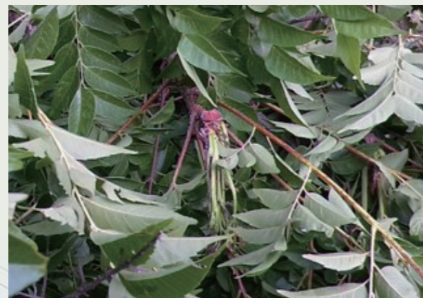
剪完後散落一地殘枝落葉，存活之荔枝椿象個體有機會爬回再度危害。

5-6月適度修剪枝條(修剪量勿超過1/3)，特別是矮側枝或萌櫟枝，但須注意勿過度修剪影響樹木生長及開花，且殘枝落葉勿棄置原處，以免蟲隻又移回。