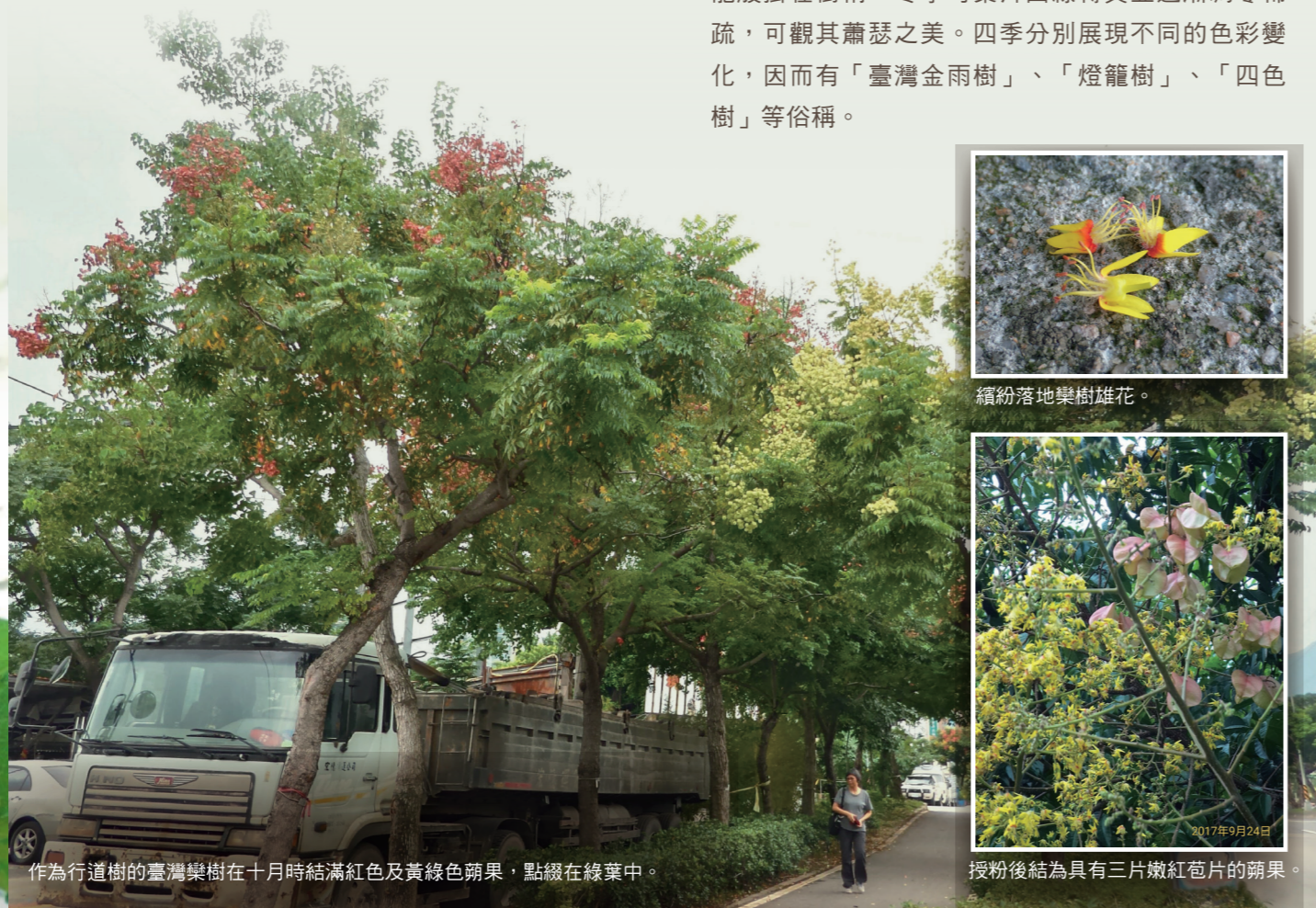
作為行道樹的臺灣欒樹在十月時結滿紅色及黃綠色蒴果，點綴在綠葉中。

臺灣欒樹相對於榕樹等其他常見樹種較具改善空氣品質的能力，且根據林業試驗所之林木疫情鑑定與資訊中心自95年起至106年收到的褐根病通報數量統計顯示，與染病數量最多的樹種榕樹相比(佔感染總比例27.7%)，歷年來染褐根病的臺灣欒樹明顯較少(2.3%)。