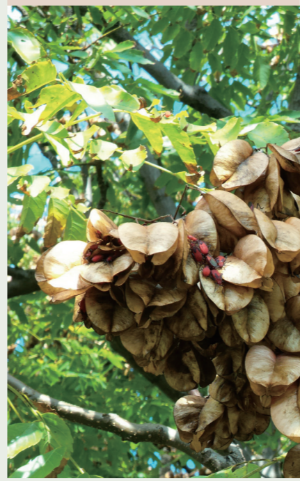
群聚欒樹蒴果權及在地上吸取欒樹種子汁液的大紅姬緣椿象(若蟲及成蟲)。

大紅姬緣椿象是不臭的椿象，成蟲與若蟲會群聚在一起，以度過寒冷的冬天，經擾動則移動敏捷快速，如同會動的枸杞般，十分趣味。