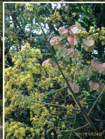
授粉後結為具有三片嫩紅苞片的蒴果。