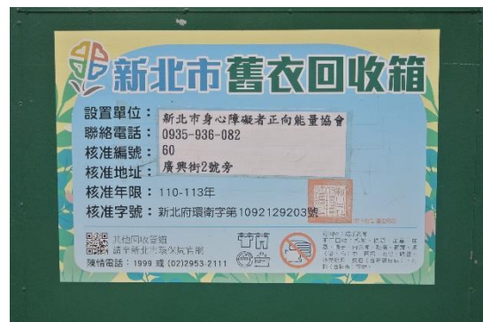
圖 3 環保單位核准標示