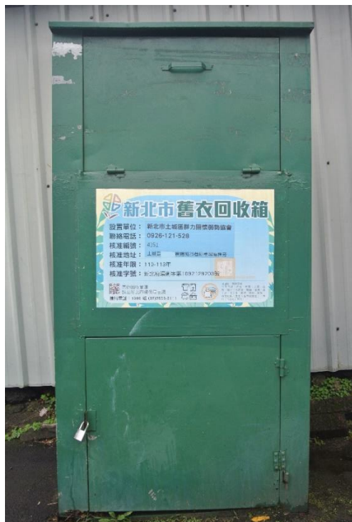
圖 2 合法舊衣回收箱