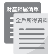
財稅機關所提供最近年度全戶所得資料及財產歸屬清單。